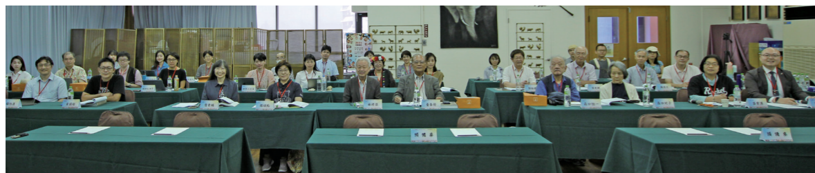
第16屆台日原住民族研究論壇開幕大合照。

另一焦點是原住民族語言，本場次3篇發表，正好均以布農語作為研究基礎或部分調查對象。森口恒一教授首先帶來關於布農語研究中的新分享，透過布農語特有的「聲門（爆破）塞擦音」，來檢視人類演化歷史中，從狩獵（食用肉類）轉變到農耕（食用澱粉）造成口腔大小的變化，對舌頭的機能產生影響，使發音器官較為成熟，語言能力得以進化。大阪大學講師野島本泰，則從森口教授歷年研究的語料集之中抽取布農語前綴詞「mu-」，此前綴在布農語5個語別皆有使用，經過彙整判讀後可以了解到大致上有指涉3種意義，本次的發表將逐一探討不同語料案例中「mu-」的用法及意涵。北海道大學愛努・先住民研究中心