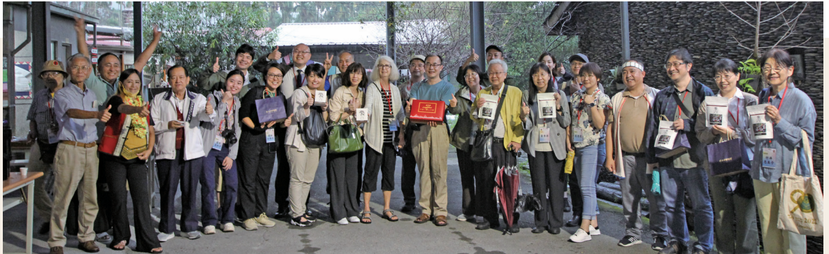
論壇結束後，部落人帶台日學者們參訪部落文建站，大家在文建站前面拿著部落自產自銷的咖啡豆合影。照片右邊為石板屋。

丹菊逸治教授、中澤陽子博士生，以火藥為主軸，討論在其原料產地大陸邊緣海岸地區、島嶼區域生活的原住民族——庫頁島尼夫赫族、北海道愛努族、台灣布農族的語言當中，與火藥相關的詞彙，從而推斷歐亞大陸內陸諸多國家具有歷史性的關聯，原住民族區域與歐亞大陸國家在歷史上也可見頻繁交流。