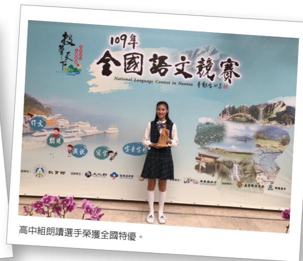
高中組朗讀選手榮獲全國特優。

眾所周知，臺上一分鐘臺下十年功，這是語文競賽獲獎的鐵律。作者每訓練一個選手，都會告誡他們：「努力不一定成功，但成功的人一定很努力。」全國語文競賽全國決賽的頒獎臺上，幾家歡樂幾家愁，特優就只有前25%，沒能站上頒獎臺絕對不是努力不夠，所以作者也告誡選手們：「成