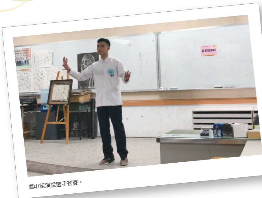
高中組演說選手初賽。