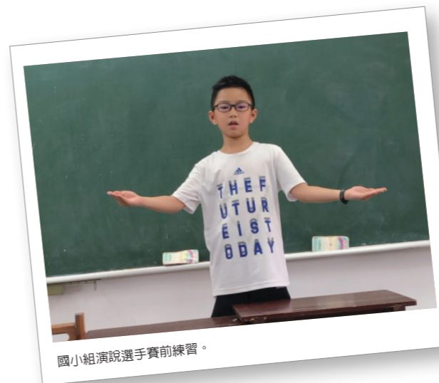
國小組演說選手賽前練習。