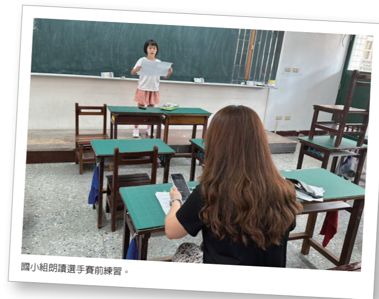
國小組朗讀選手賽前練習。

在小學階段，要選出一位優秀的選手，除了指導老師的慧眼之外，還要有學生的配合及家長的支持。到了中學階段，這些在小學有優秀表現的選手們，因課業繁重，往往被迫中斷選手身分，這點真的非常可惜！