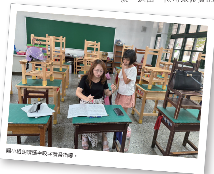
國小組朗讀選手咬字發音指導。