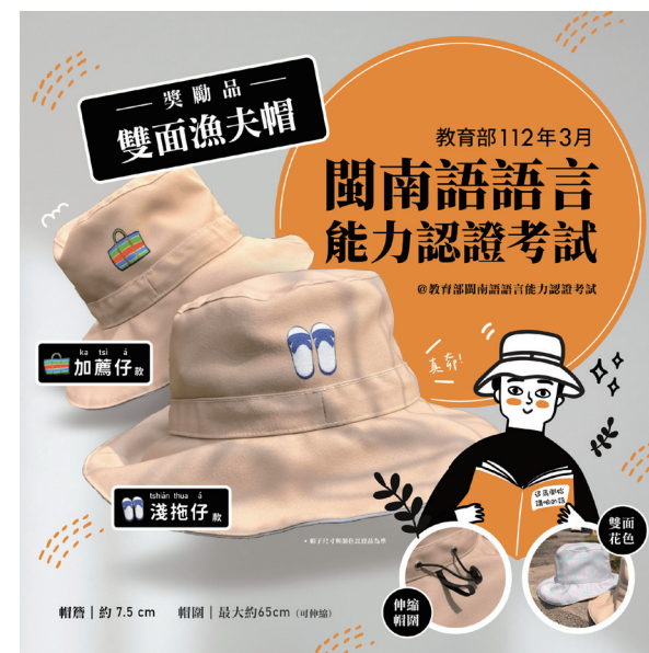
教育部112年閩南語語言能力認證考試獎勵品。

力。政府期待藉由持續辦理閩南語語言能力認證考試，提升國人對閩南語文的興趣，加強國人使用閩南語文的能力，進而保存及推廣本土語文。◆