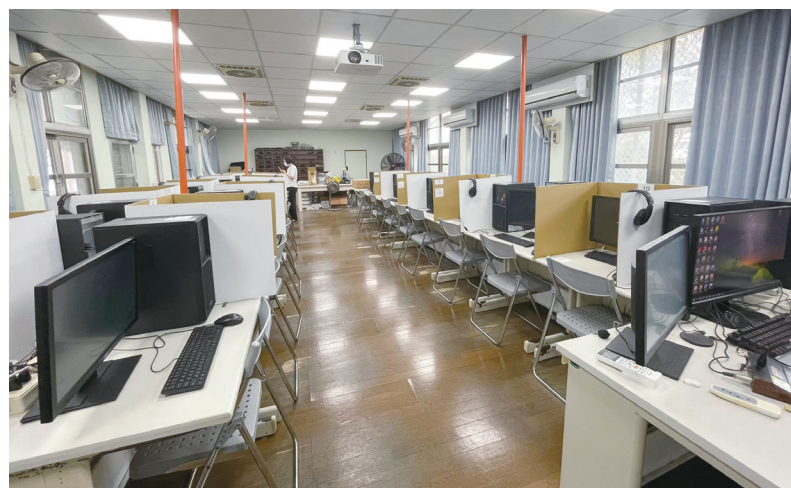
2022年4月22至23日，台東新生國小認證測驗巡場。

原住民族語言能力認證考試（以下稱認證考試）自民國90年開辦，根據黃美金〈原住民族語言能力認證：回顧與展望〉文章，首次辦理測驗主要是為了因應九年一貫課程需要族語老師教授族語課，也開啓了以族語文方式傳承族語。認證方式共分三種：薦舉、書面審查、筆試及口試。隨著原住民族語言振興政策的推展，原住民族語言發展環境與現況與十年前有所不同，辦理測驗目的也從最初需大量稱職師資，轉變為族語保存與推展族語，鼓勵大眾甚至非族人學習族語。