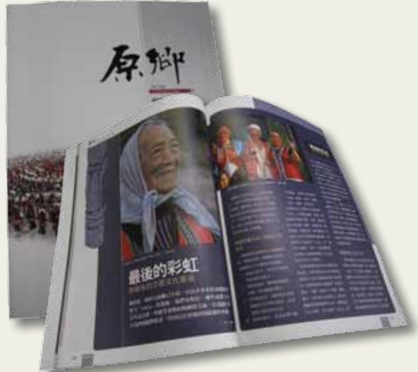
現今的原住民自辦刊物，呈現不同於原運時代與部落報的面貌。左為週報性質的《台灣原民報》，右為年刊性質的《原鄉》雜誌。

展開，才慢慢成長茁壯。1983年5月，一群在台灣大學就讀的原住民學生發行《高山青》這份刊物。《高山青》敲醒了原住民的主體意識，之後，自辦刊物便如雨後春筍般地冒出，配合原住民運動的潮流，高低起伏地發展；除了原住民主體性的建構，還有原鄉在地的發聲。