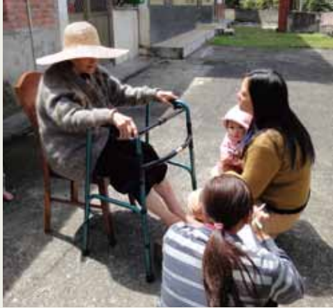
四季部落工作隊的年輕人在部落進行田野採集與記錄。