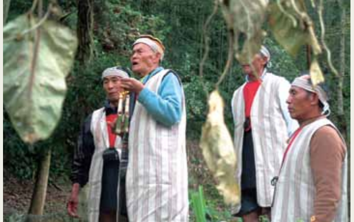
青年們可以透過部落報，吸取耆老們的傳統智慧經驗。