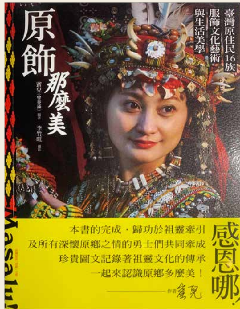
《原飾那麼美！臺灣原住民16族服飾文化藝術與生活美學》。

耗時七年製作的《原飾那麼美》，是台灣原住民16族服飾文化藝術「微百科」，但是要談「微百科」之前，需要先敘述「我」是誰才能完整表達我是用什麼眼光欣賞這本書。