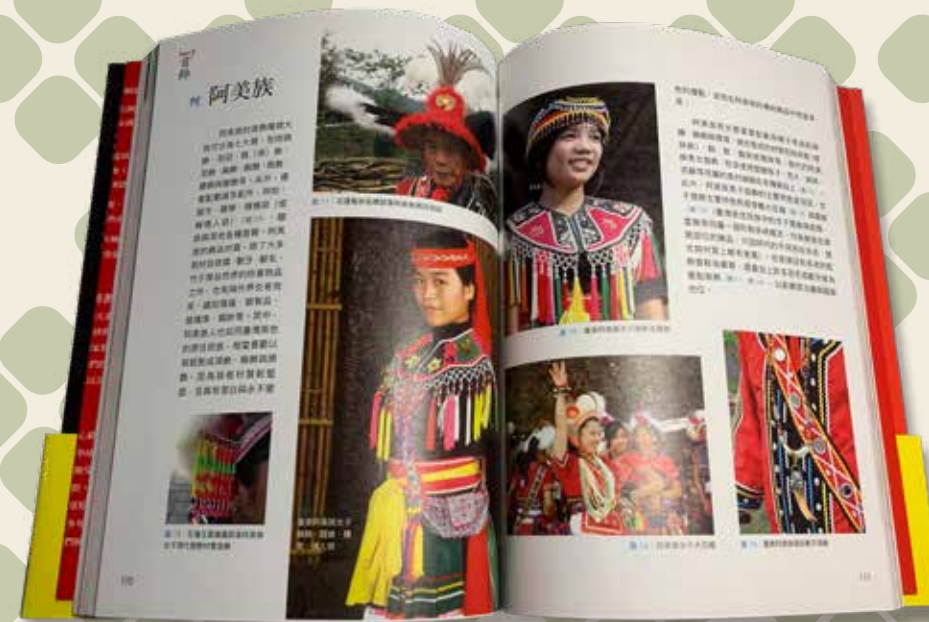
《原飾那麼美》阿美族首飾介紹。

我是出生在台北的阿美族，上大學以前是班上那唯一擁有特別身分的人，而我對自己的身分認同在小學期間經歷了一段跟標籤拉扯的旅程，我「符合期待」地加入了原住民兒童合唱團，同時兼差田徑隊，但卻又「不符合期待的」，是班上成績