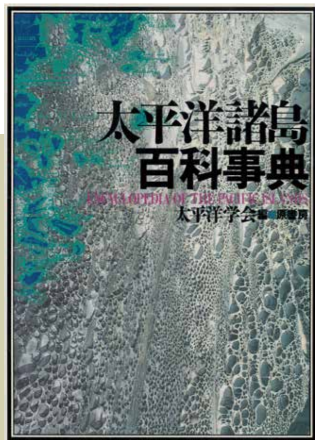
日本太平洋學會《太平洋諸島百科事典》書殼。(原書房 1989 年出版)

全世界關於太平洋諸島的百科事典目前只有兩個版本，一是由日本的太平洋學會在 1989 年出版的《太平洋諸島百科事典》，即本文主要介紹的著作（以下稱為「本書」），而另一本則是由夏威夷大學在 2000 年出版的 THE Pacific Islands: an