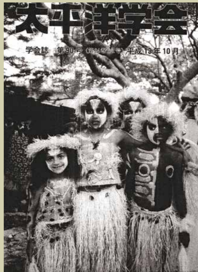
《太平洋學會誌》第90期封面：新喀里多尼亞樹島的孩子們（攝於第八屆太平洋藝術節）。