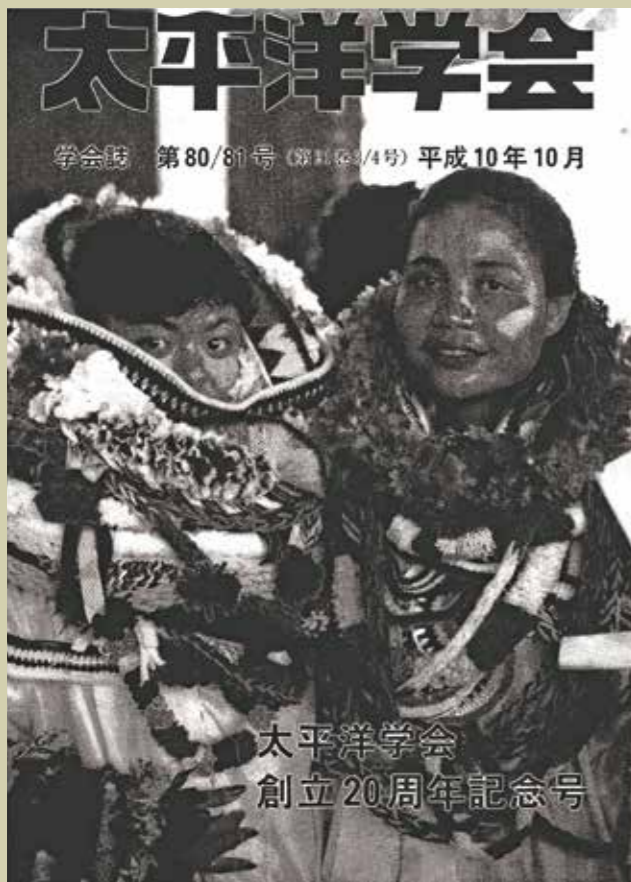
《太平洋學會誌》第80 / 81期（創立20周年紀念刊）封面：雅浦高中畢業生戴著慶祝用的花朵裝飾。

若以現在的眼光來看，這兩個版本當然都會有一些需要更新、修正或補充的部分，不過，它們作為此類著作先驅的地位依然是屹立不搖的，甚至到目前為止都還是後無來者的狀態。在第三個版本出現之前，這兩本百科事典無疑都將是我們在廣闊無垠的太平洋知識之海中航行時，為我們指引方向、最可靠的兩座燈塔。◆