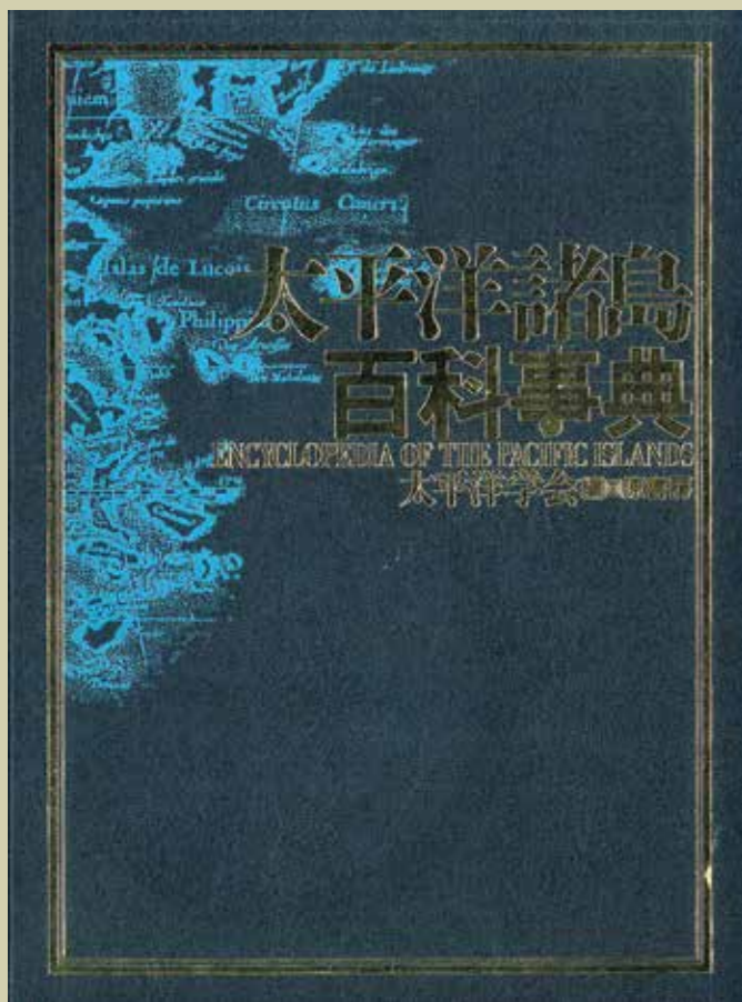
日本太平洋學會《太平洋諸島百科事典》書封。（原書房1989年出版）