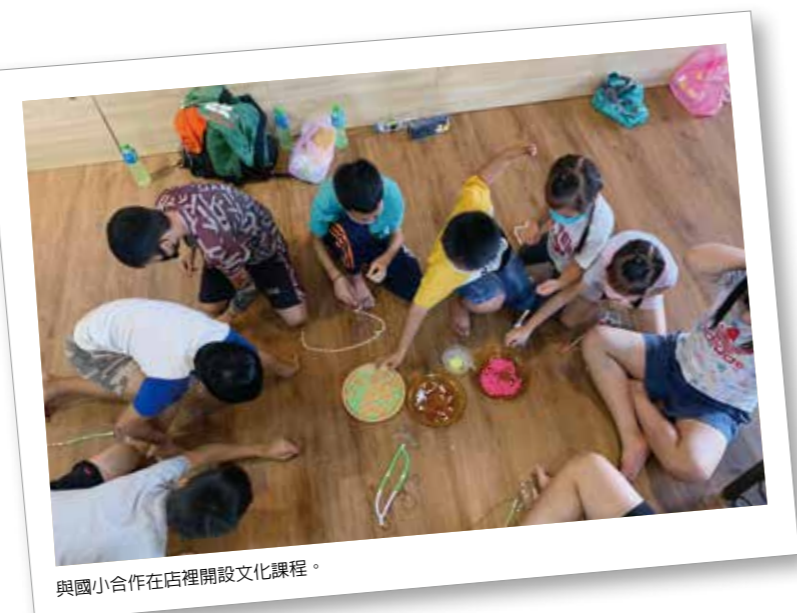
與國小合作在店裡開設文化課程。