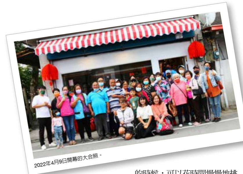
2022年4月9日開幕的大合照。

筆者看到上述情況，便開始構想在此地創立工藝材料行的可能性，過去筆者曾在部落開設製作傳統服飾的