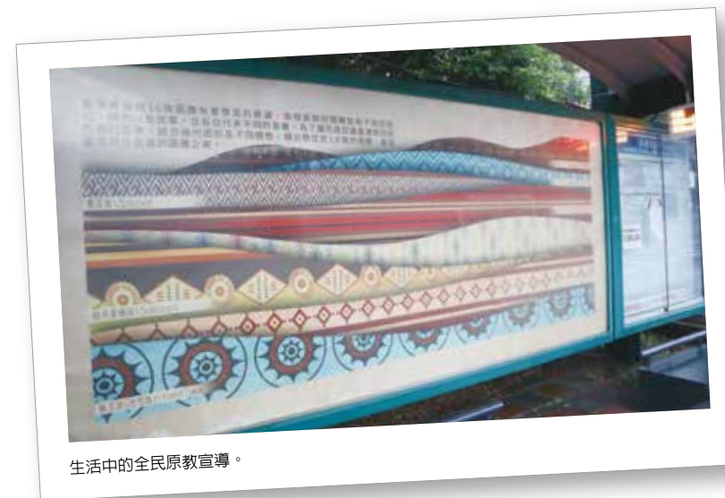
生活中的全民原教宣導。

方能釐清原住民族與其他民族在歷史正義、轉型正義之間的關聯和差異，並且透過與其他夥伴的共學，看到全民原教另一種可能的開始；其中不僅有社會領域的老師參與培訓，也有許多其它領域或學科如語文領域、自然科學領域、藝術領域（表演藝術）、綜合活動領域（家政）等夥伴教師一同加入，大家都是基於想更認識或進一步理解原民議題，而願意在緊湊繁忙的學期中開發原民個人教案，並尋找有緣的夥伴一起建立小組進行合作……透過不同學科的養成背景與專業視角，讓教案方向開展更加多元深刻，在在顯示全民原教的必要性。這次參訓雖歷經三階段，但為期僅僅兩個月左右，加上第一階段後就得撰寫個人教案，在有限的時間及本職工作夾縫下，我直覺挑選在人權