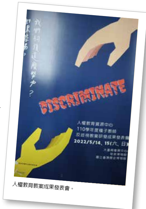
人權教育教案成果發表會。