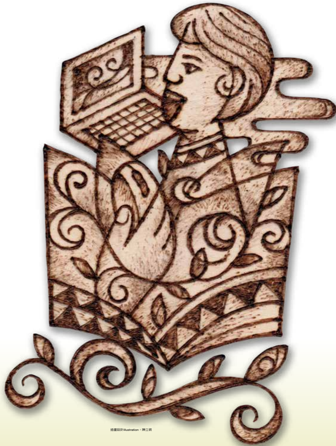
插畫設計 illustration · 陳立君