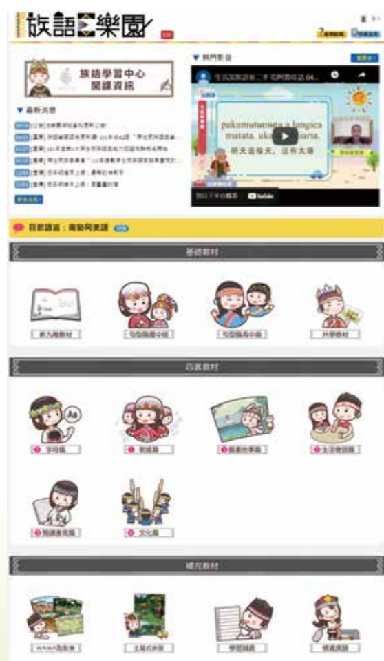
可以利用族語E樂園的線上學習資源學習族語。

以學校教育類型為主的教材，更有配合教學方法和學習族語方式各類多元的教學輔助及其他間接發揮族語教學成效的材料，包括繪本、教具、評量工具等。族語教材面對最大的質疑，並不在教材本身，而是搭配教材而發展的教學法或教學活動設計，但這涉及到教學法的原則與運用，也牽涉到教學者在教學現場面對學生的實際運用。