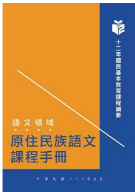
十二年國民基本教育課程綱要之語文領域-本土語文(原住民族語文)課程手冊封面。

因此，族語教材與族語教學法是族語教學實施的兩大關鍵面向。在這兩個面向當中，教師扮演重要角色。一方面，教師有必要透過各種管道，努力探索具備該語言的相關知識，調整教材的目的和內容。另一方面，教師有必要