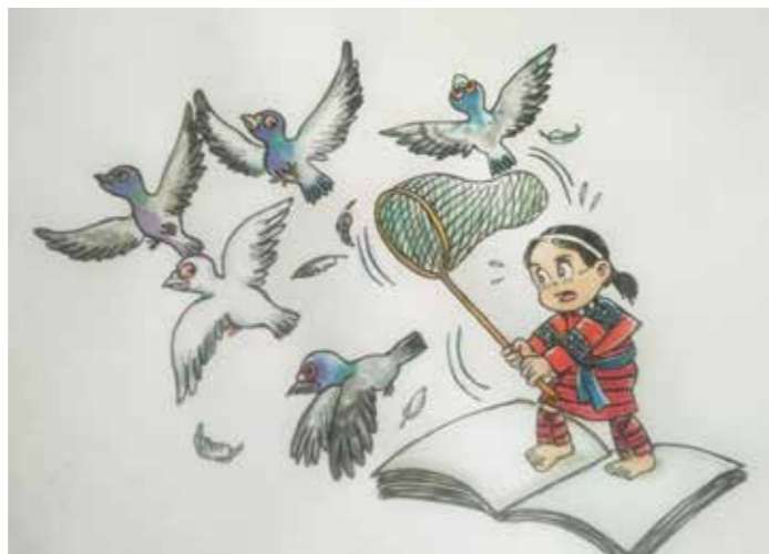
身為主編最艱困的莫過於被「放鴿子」了，此為筆者老公親筆所繪製的示意圖。

而掌握撰寫群進度又是一大挑戰，最艱困的莫過於被「放鴿子」。截稿前表示「正在寫...再給幾天的時間...」云云，雖勉為其難卻仍硬著頭皮「寬容」，但最終竟人間蒸發般消失，電話與mail都不接不回，甚至還需要動用關係去關切；有的則是當面允諾供稿，正式邀稿後卻連電話都不接。原教評論是提供官學產的平台，由於主管機關多為教育部和原民會，難以避免會重複邀稿，無形中也給政府機關壓力，惟層層審核，等候稿件自然也成為另一個壓力。官員是不至於消失，但在截稿日卻以「近期工作忙