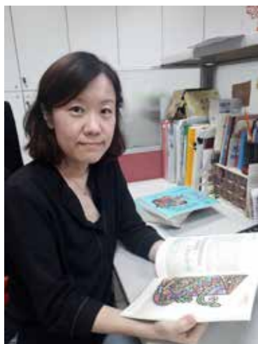
透過閱讀《原教界》來充實原住民族教育理論與實務的知識。

助原住民族委員會推動原資中心政策，當期收錄大學、技職、專科等不同性質學校原資中心的現況，以及他們對於原住民大學生輔導工作的困境，恰恰可作為我了解各校原資中心發展，以評估後續政策的可能方向。