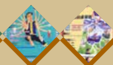
羅福慶 Raranges Hoki na Tungaw 第14,20期