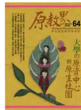
《原教界》介紹近期的重要議題及動態，可用以評估政策的可能方向。

我真是如獲至寶，還記得我花了2週的時間，一口氣從第1期「原住民族教育向前走」讀到第54期「原住民族教師的人生」，像海綿般努力充實我在理論與實務上的欠缺。