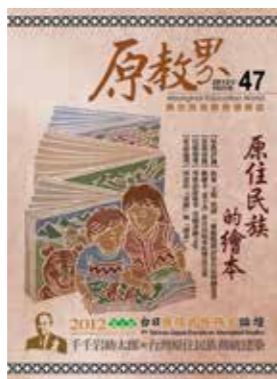
議題多元的《原教界》滿足了教育工作上的其他需求。

助原住民族委員會推動原資中心政策，當期收錄大學、技職、專科等不同性質學校原資中心的現況，以及他們對於原住民大學生輔導工作的困境，恰恰可作為我了解各校原資中心發展，以評估後續政策的可能方向。