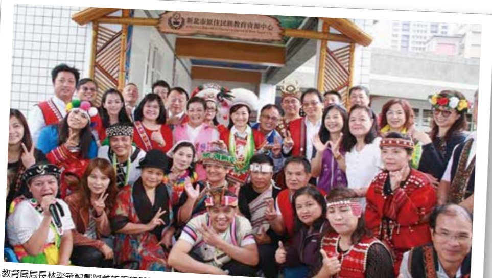
教育局局長林奕華配戴阿美族服飾與原住民籍議員及校長們以插冠方式，於2017年10月28日出席新北市原住民族教育資源中心揭幕活動。