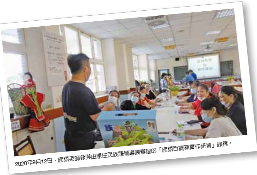
2020年9月12日，族語老師參與由原住民族語輔導團辦理的「族語百寶箱實作研習」課程。

市內幅員遼闊，而原住民地區僅有一個行政區域—烏來區。市內原住民族籍人口16族皆有，其中以阿美族最多，其次為集中於烏來區的泰雅族，其餘族別人口比例雖相對不多，但卻也分散於各區。市內位於原住民地區的學校，僅烏來國民中小學及福山國小2所，另有8所原住民族重點學校位於非原鄉