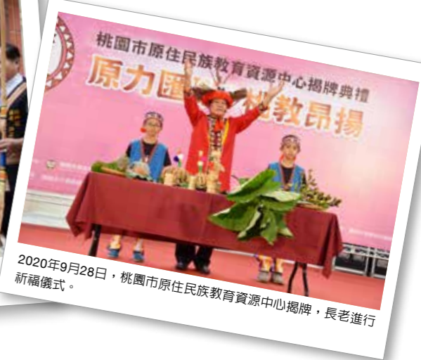
2020年9月28日，桃園市原住民族教育資源中心揭牌，長老進行祈福儀式。

式 ：創新規劃遠距教學模式，媒合需求學生進行線上同步教學，維護原住民族學生學習權益。規劃成（1）辦理族語遠距教學教育訓練；（2）媒合族語遠距教學嘉惠原住民族學生；（3）培育族語遠距教學師資。