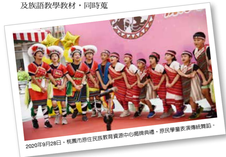
2020年9月28日，桃園市原住民族教育資源中心揭牌典禮，原住民族學生表演傳統舞蹈。

族之民族教育課程規劃與評量方式」，及推動原住民族教育相關事務之重責。讓原住民族孩子透過認識族群文化進一步來認識自己，建立自我認同與使命感。讓桃園市原資中心匯集本市原住民族行政局及各方教育資源，傳承文化並提升學習競爭力，讓桃園原住民族子弟成為國家未來發展的重要力量，並促進桃園市原住民族教育的傳承與永續發展。◆