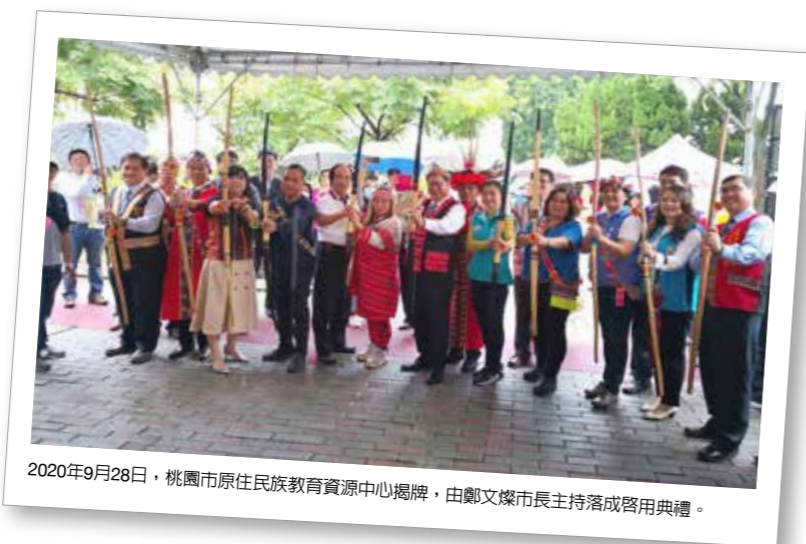
2020年9月28日，桃園市原住民族教育資源中心揭牌，由鄭文燦市長主持落成啟用典禮。

根據原民會網站公布，本市原住民族人口數，截至2021年3月底統計有7萬8,037人占全國原住民人口13.50%位居第三，本市都會區原住民族達6萬9,193人，佔全國24.70%，將近1/4，其中阿美族3萬7,226人最多，其次是泰