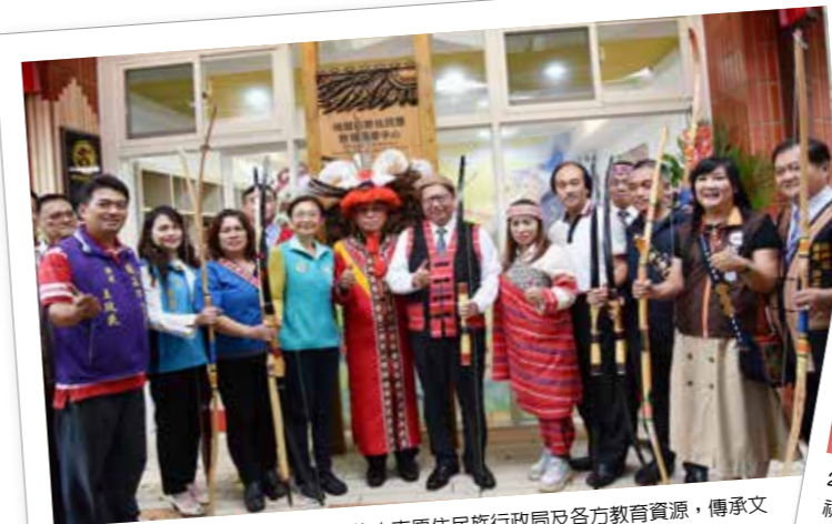
讓桃園市原住民族教育資源中心匯集本市原住民族行政局及各方教育資源，傳承文化並提升學習競爭力。