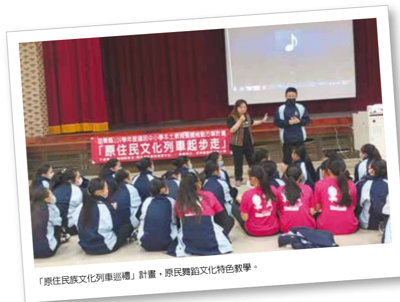
「原住民族文化列車巡禮」計畫，原民舞蹈文化特色教學。