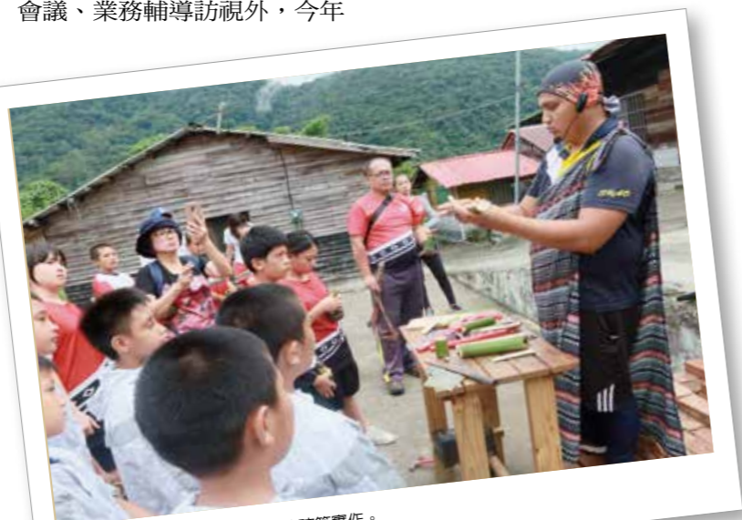
「候鳥返鄉」計畫，環保竹杯及竹碗筷製作。

將充實原教相關書籍、教材教具及影音等，並建立中心專屬網站與數位學習平台。在研發修正、編印與推廣以提供學生使用之原住民族語、文化、教育教材及研發與推廣原住民族教學方法及評量上，除了廣續2020年苗栗縣賽夏族語及澤敖利泰雅語第二冊教材研發外，繼續研發與出版多元化教材。在辦理原住民族教育相關研習或活動方面，除了廣續辦理多元師資增能培訓研習和學生文化學習課程、踏查與尋根之旅外，今年特別透過新夥伴原計畫，規劃全民原教種子教師培訓營、原民部落文化采風、苗栗縣原住民族語說唱藝術競賽等，期能深化大眾對原住民族文化的理解與尊重。