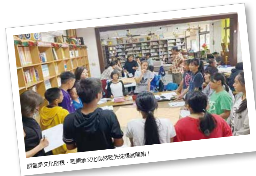
語言是文化的根，要傳承文化必然要先從語言開始！

綜觀本縣原資中心的工作內容，皆可看見政府團隊的努力與用心，讓原住民族教育成為本縣一大特色，然而政府施