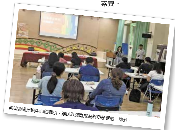
希望透過原資中心的導引，讓民族教育成為終身學習的一部分。

部落遊學是近年來興起的深度戶外體驗學習，中心欲結合在地部落辦理體驗、情境、參與的遊學，透過互動讓社會大眾認識部落文化，並藉此認識屏東多元之美，讓更多的縣民能共同參與族群主流化的建構，使其成為縣民的基本公民素養。