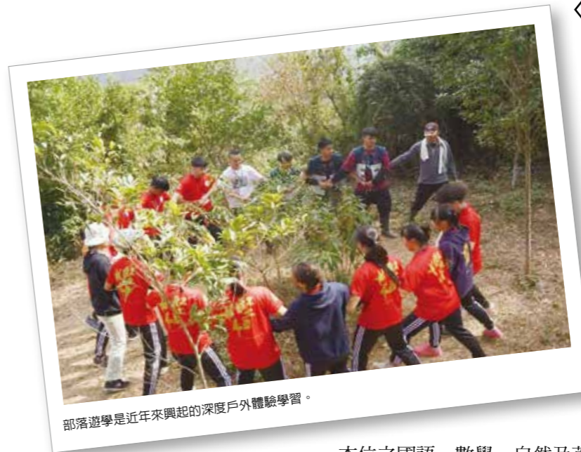
部落遊學是近年來興起的深度戶外體驗學習。

「原民主體」是希望透過原資中心的成立，能協助各級原住民族重點學校發展以民族文化為主體的知識系統，讓下一代除了能傳承文化語言外，更能建構屬於自我的族群認同。