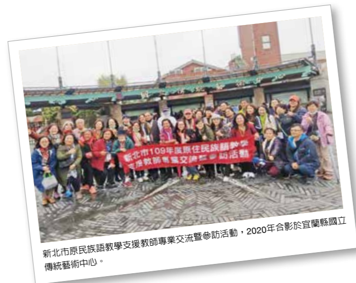
新北市原住民族語教學支援教師專業交流暨參訪活動，2020年合影於宜蘭縣國立傳統藝術中心。

Mangata to ko cecay a mihecaan ko tayal no mako, onini a Yincong sin, Marecad to loma' no pakafana'ay, o cimacima to a pasifanaay to caciyaw no Yincomin i, manga'ay tayni a minanam a