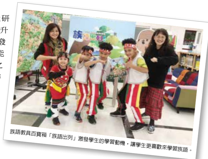
族語教具百寶箱「族語出列」激發學生的學習動機，讓學生更喜歡來學習族語。

Pahanhan ko mitiliday, ira haca ko padama no Yinceongsin, namacakacakat ko taneng fenek no pakafana'ay, masaopo itini a minanam mafafalic to nafana'an no faloco' ato rakat maainini no caciyaw no kasafinacadan, ano manga'ay i, ira a malalicalicay to matanengay, sakacakat to fana'. Oromasato, palaheci ni Kaw-siw-i colen ko nanicompi, patiri, masasowasowal a dademaken, ira ko pipato'or, malalanaw, namahapinang ko nitayalan, ikor to mapararid amidemak to hatini'ay a tatayalen.