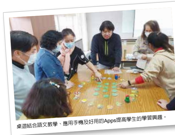
桌遊結合語文教學、應用手機及好用的Apps提高學生的學習興趣。