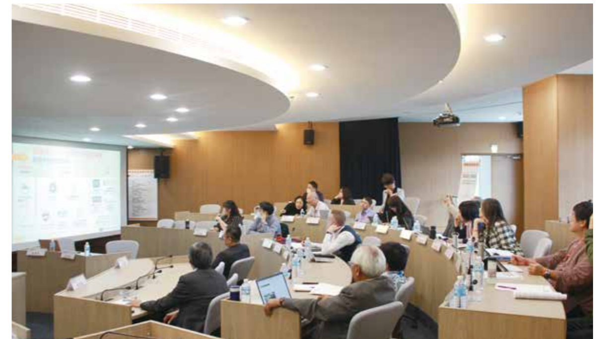
政大原住民族研究中心主辦之台日論壇，現場的與會學者們一同關注南島議題。

政大未來的南島研究方向會朝三大方向並行，第一，跨科系所中心的內部整合；第二，在台灣原住民研究的基礎上發展南島研究；第三，發展完整的國際南島研究成為政大的特色。◆