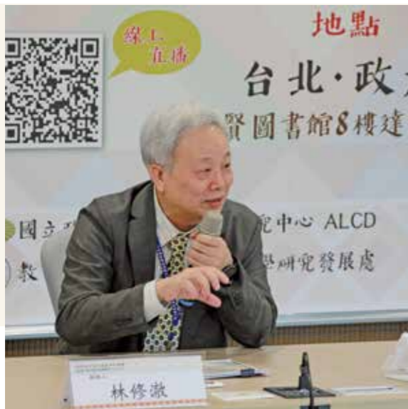
政大原住民族研究中心負責督導，並推動執行「南島論壇」與「南島研究」的相關工作。