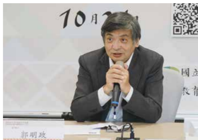
郭明政校長積極拓展政大的南島研究。

為 推展政大的原住民教育與研究、開拓廣大的南島語言文化及環境永續的交流與合作，政治大學的構想也就是郭明政校長的構想，是先整合校內對南島研究（包括原住民研究）的研究資源，一方面承接原民會的「南島民族論壇計畫」，另一方面積極發展政大的「南島講座」。藉此，政大不僅整合校內南島研究資源，從此在國內搭起政大與原民會友誼的橋樑，攜手為原住民族及南島語族做出極大的貢獻，在國際上將政大塑造成國際南島研究重鎮。