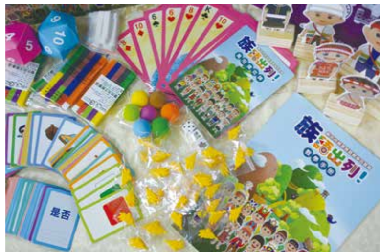
百寶箱內容物適用於各個想要學習族語的年齡層。

制，帶入遊戲可以提升孩子學習族語的興趣及增進學習族語的效能。於是……，我開始著手寫遊戲教學教案，並在團務會議拋出這個議題，團員們都覺得這很有意義又非常有趣，我們將研發族語遊戲教學法納入團務會議年度工作，團員們無私的貢獻出自己的創意與想法，過程中有2期不同組合的