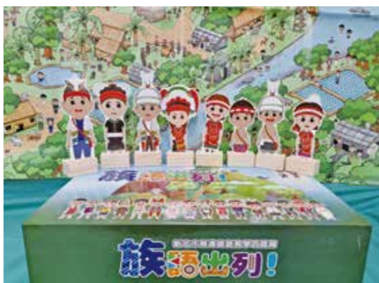
百寶箱內附有8款人物及部落大地圖。