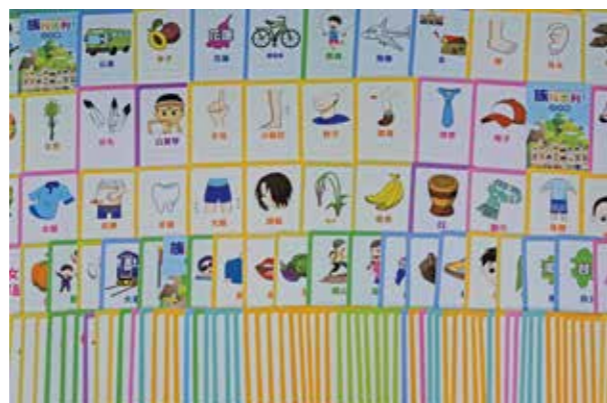
百寶箱內的275張常用字卡。