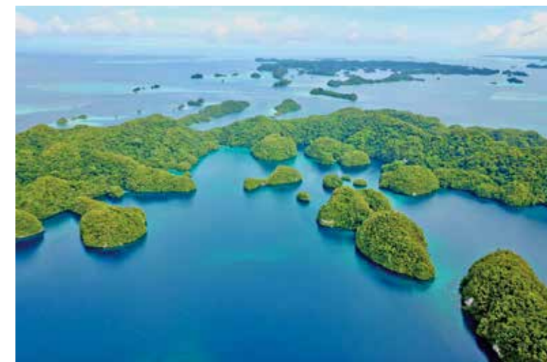
帛琉洛克群島鳥瞰圖。

《保護區網絡法案》(Protected Area Network) 起於2003年，旨在建立全國性的陸路及海洋生態保護區，並致力在2020年，達成密克羅尼西亞挑戰賽 (Micronesia Challenge) 一旨在保育30% 以上的地方海洋資源和20% 的陸路生態。帛琉政府協助地方組織、傳統領袖和科學家，共同研究地方生態系統；賦予州政府及社區施行規劃和管理保護區的權利；並協同社區、州政府和國際資源，建立從陸地到海洋的生態保護網絡，以確保自然資源的永續發展。傳統「bul」的精神擴大發展成為