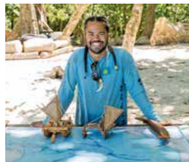
帛琉當地的海洋嚮導。

「bul」的方法除了反映在《保護區網絡法案》外，也是《海洋保護區法案》 (Palau National Marine Sanctuary, 帛琉語稱Euotelel a Klingil a Debel Belau) 的基礎精神。2015年10月28日，帛琉共和國雷蒙傑索總統