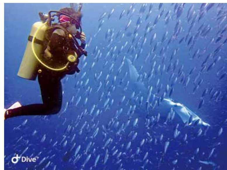
帛琉擁有富饒的海洋生物資源。

阿美族，新北市人，1987年生。政治大學民族學系畢業，英國薩塞克斯社會發展碩士。曾任國際志工社副社幹部、副社長、南投縣親愛國小萬大分校育樂營隊長，嘉義縣重寮國小育樂營隊輔、臺北國際服務隊志工、青海國際服務隊長，長期投身各項服務工作。於2019年11月起常駐帛琉。現為南島民族論壇帛琉總部執行秘書。