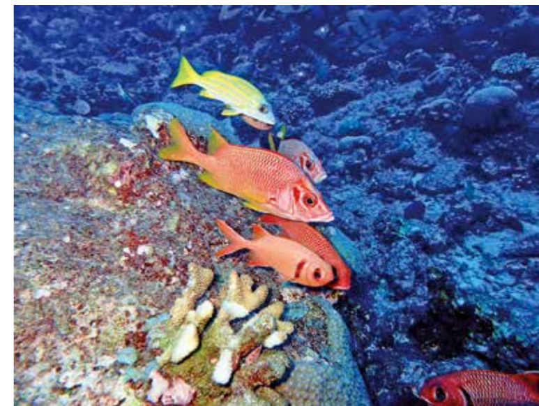
帛琉擁有超過1,300種的魚類和700種的珊瑚種類。

面對全球化、資本主義和氣候變遷，帛琉也不免於受到衝擊。然而在各國視經濟成長為主要驅使因素時，