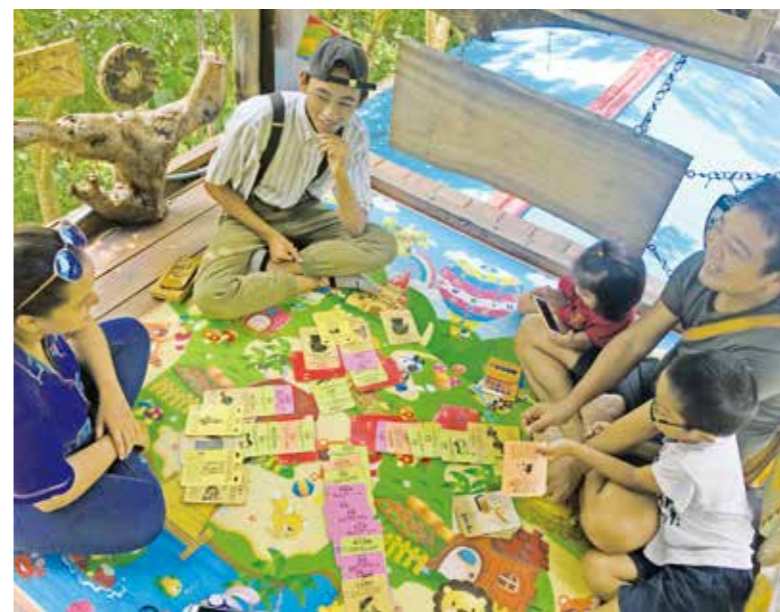
玩排灣族部落公法人桌遊實況。

這些經營實作的經驗，有許多酸甜苦辣，也帶來了許多反思，一開始就馬上面臨必須要放棄原有的工作才能獲得獎金，最後為了想創業只好忍痛放棄，當時先生剛離開前一份工作，對沒有收入的我們來說非常掙扎。那年參加了在紐西蘭舉辦的世界社會企業論壇，