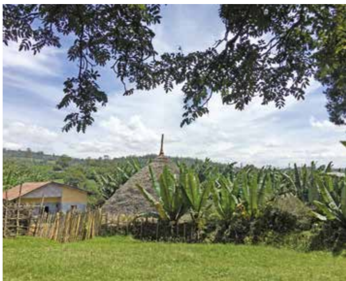
衣索比亞家庭農莊計畫。