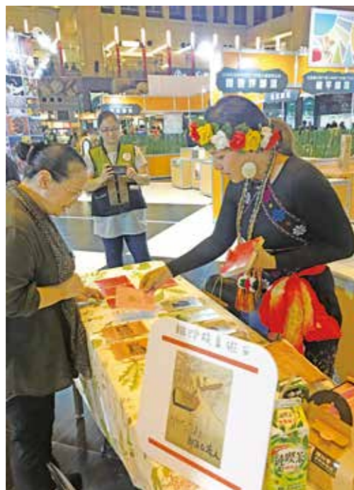
向參觀者解說排灣族部落公法人桌遊。

族人們創業的內容大多趨向農產業，像紅藜、小米，文創商品，例如長得很相似的飾品，比如開發觀光旅遊，就一定會有射箭或搗小米或糯米，容易讓外界將原住民16族均質化。發展工藝產業時，持續專注在基礎訓練，如編織、木雕等，這類課程至少也做了20年以