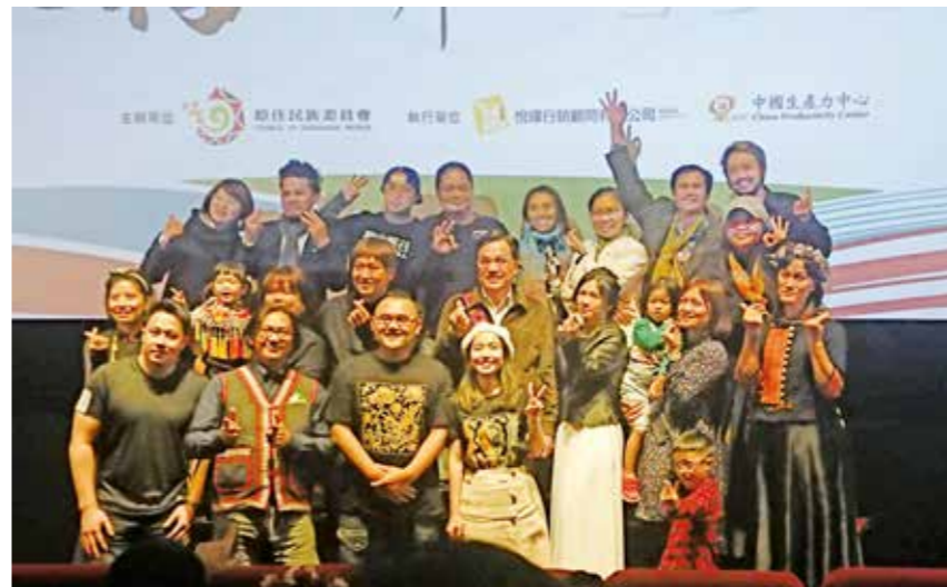
原住民族產業相關工作者合影。

涵就是企業對於地球社會的責任，世界的企業家開始在反思極端資本與個人主義的缺陷，透過社會企業為目標讓社會變得更好。這個倡議活動很年輕，2008年在英國愛丁堡舉辦首屆論壇，而台灣原住民族社區早已從自身文化中衍生出共享共存的產業發展模式，例如我們公司發揮共享精神展現在桌遊產品，以收入的1%回饋給排灣族民族議會，協助發展排灣族的自治與人才培育。