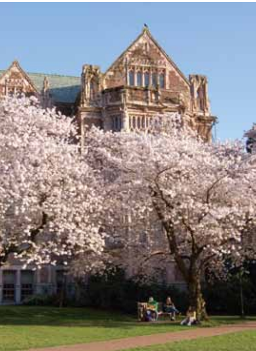
華盛頓大學校園一景。