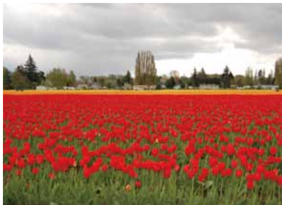
華盛頓Skagit Valley的鬱金香花田。

能申請，採書面審核制，申請時間約在每年1月底或2月初。上述兩種獎學金皆可至教育部國際文教處網站查詢。