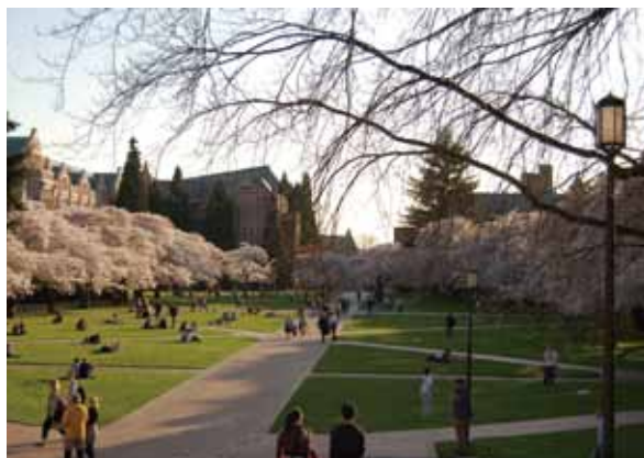
每年3月底至4月初，華盛頓大學校園內的櫻花盛開。