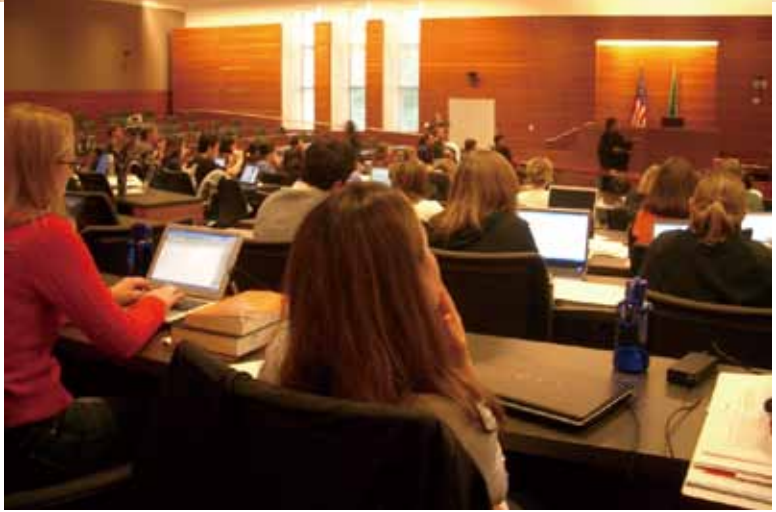
華盛頓大學法學院內的上課情形。

為了使外國學生能夠一開學就適應法律課程，美國法學院特別開設為期1個月的暑修課程，內容為美國法的導論。