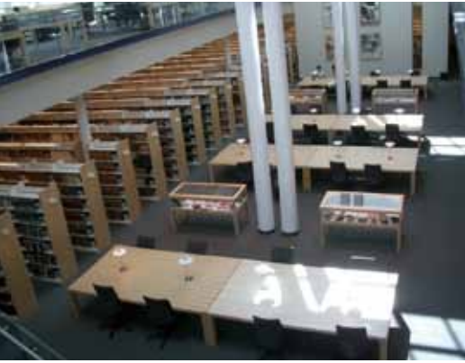
華盛頓大學的法學院圖書館。

公里。西雅圖市算是非常年輕的城市，建立於1850年代。由於華盛頓州到處生長著高高的針葉樹，即使到了冬天，西雅圖市仍舊一片綠意盎然，因此又稱為「長綠市（Evergreen City）」、「翡翠之都（Emerald City）」。或許是因為西雅圖的氣候舒適，再加上華盛頓州免州稅政策，許多著名企業將總公司設立於此，如波音、微軟、亞馬遜網路書店、星巴克等。華盛頓大學（University of Washington）是州內最早設立的公立學校，也是目前華盛頓州最好的公立學校。