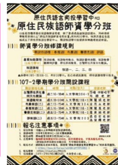
南投族語學習中心海報——107-2學分班。