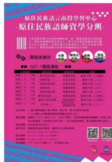
南投族語學習中心海報——107-1學分班。

依據原住民族教育法第4條第1款原住民族教育係指原住民族之一般教育及民族教育之統稱。第3條原住民族之一般教育，由教育主管機關規劃辦理；原住民族之民族教育，由原住民族主管機關規劃辦理，並會同教育主管機關為之。過去(107學年度之前)原住民族語言師資培育機構，大都由國立師範大學進修推廣部承辦。過程中，台北市立教育大學進修推廣部、東華大學原住民族學院相繼承接辦理，提供通過原住民族語言能力認證者，或是想繼續充實相關專業知能者修習教材教法、教學觀摩