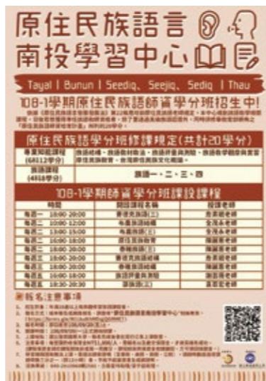
南投族語學習中心海報——108-01學習班。

族語課程依據原住民族主管機關所規劃的辦理，從族語(一)到族語(四)計8個學分。從會說、會聽、會透過書寫符號的拼讀、