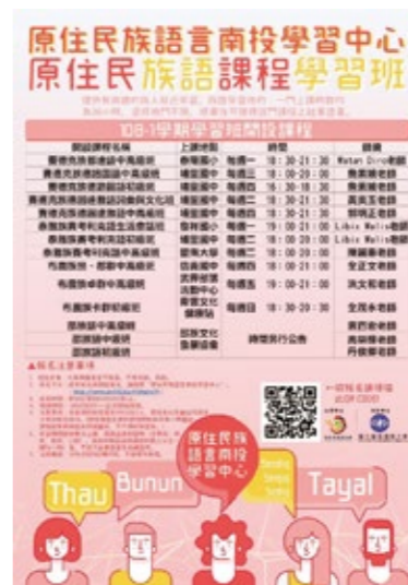
南投族語學習中心海報——108-1學習班。