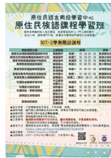
南投族語學習中心海報——107-2學習班。