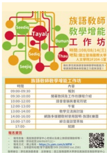
族語中心知能工作坊。