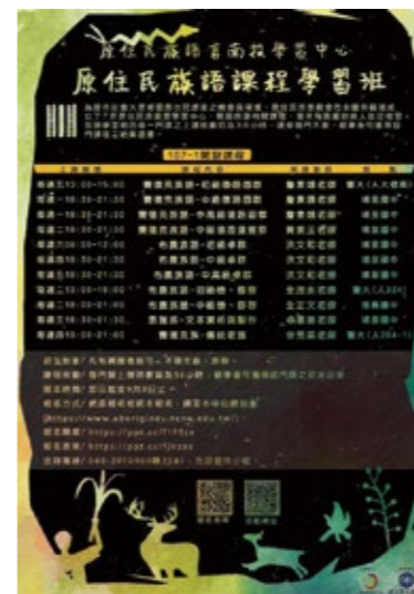
南投族語學習中心海報——107-1學習班。