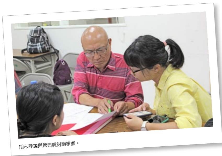
期末評鑑與營造員討論事宜。

本班 (兼職班) 以政大九階族語教材的第一至三階為主軸，為了能更讓學生於生活上直接應用邵語並非應付考試，課堂輔以教育部全國語文競賽所使用朗讀文章，以及四套族語教材中《生活會話篇》裡面的對話文本為補充教材。嚴實的規劃總還是抵擋不住現實的變化，班級成員雖有強烈的學習意向，但是每個人的時間都破碎，常忙於其他外務，因此沒辦法穩定的出席每堂課。丹老師對此無奈地表示：「如果每個人都分開來上課，等於同樣的內容要重複的說三回，進度上就不好掌握。但是