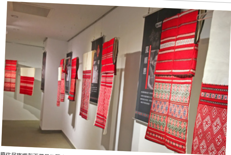
原住民族織布不僅是工藝也是藝術，其中紋飾亦帶有特殊意義值得研究。

2001年到2017年共有16篇論文，其中織布有11篇，編織有3篇，相關教育方面的論文共有4篇。可以看出，學術界在織布編織研究上，教育工作研究有萌芽的趨勢，但仍相當缺乏，亟待發展。