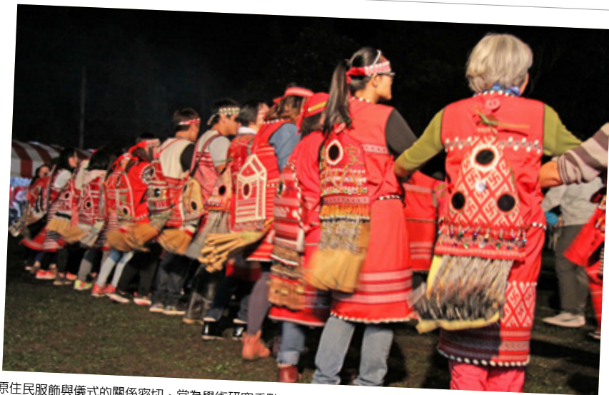
原住民族服飾與儀式的關係密切，常為學術研究重點。