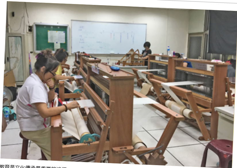
教育是文化傳承最重要的途徑。

廣度。台灣原住民族與南太平洋原住民族的關係緊密，若學術界能將相關論題拓展之，使其成為具有國際性的研究，則可帶動國內對於原住民族織布及編織研究的投入。