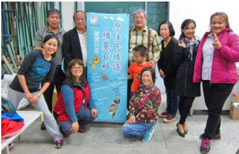
泰雅語孵育場為實作模式，以文化課程為主軸，再輔以孵育場實作教學，以維持孵育場的活躍狀況。

基孵育計畫超過1,000項，截至2017年12月15日的數據顯示，最具活躍的8項計畫，分別為 Amis Wikipedia、Atayal Wikipedia、Darja (Algerian Arabic) Wikipedia、Gorontalo Wikipedia、Ingush Wikipedia、Pashto Wikivoyage、Sakizaya Wikipedia、Shan Wikipedia（含維基百科wp-7項、維基導遊wy-1項）。其中，台灣的原住民族語言就佔了三項，分別為