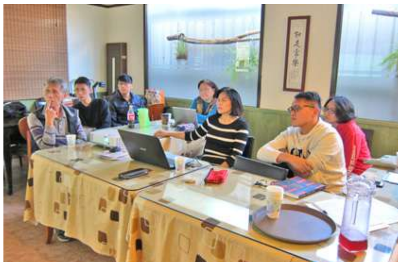
賽德克族採以師徒制方式，不定期辦理寫作聚會，若能投入人力資源全力衝刺，將會是匹相當有潛力的黑馬。

語言存在的意義就是用書寫創造出可能性，用族語書寫百科條目就是一種反向操作、顛覆經典的可能性。族語不只能書寫傳統文化、書寫九階教材、書寫詞典、書寫朗讀文章，更能書寫百科類的知識性、國際性條目內容，展現語言的活化能力。