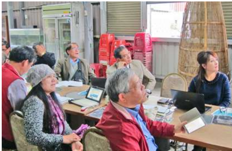
阿美族以翻譯模式執行孵育計畫，寫作團隊展現緊密的團隊默契與寫作力。

的簡報，主題為機關、遺址、植物...等，再由老師提供族語書寫建議，這樣的模式可培養本族青年族語書寫能力，達到語言傳承的目的。然因孵育場的部份，仍維持由原民中心維基助理統一更新至孵育場，與阿美語孵育場面臨一樣的狀況，使用人數一直無法實質成長，無法在孵育場上看到顯著的成果。