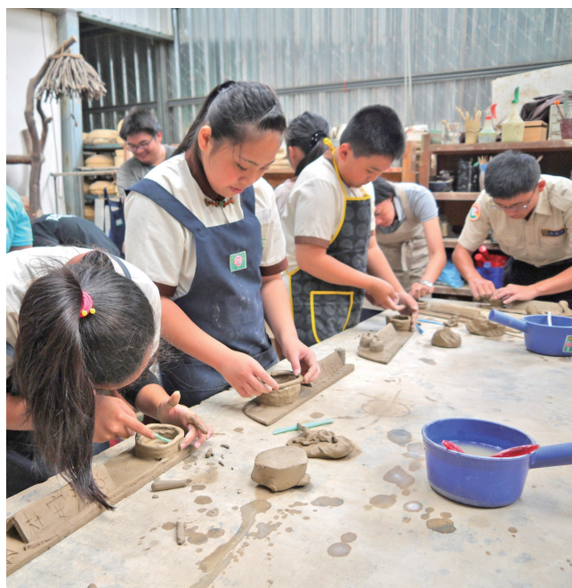
地磨兒國小的小朋友在教學活動中專心製作屬於他們的土器。

排灣族，屏東縣三地門鄉口社部落人，1966年生。1988年畢業於屏東師專，現為屏東大學教育行政研究所準博士。現任地磨兒民族實驗小學校長。基於對原鄉教育的使命與責任，也秉持著「莫忘初衷」的志業，一直期望自己成為孩子們「築夢與圓夢」的推手。