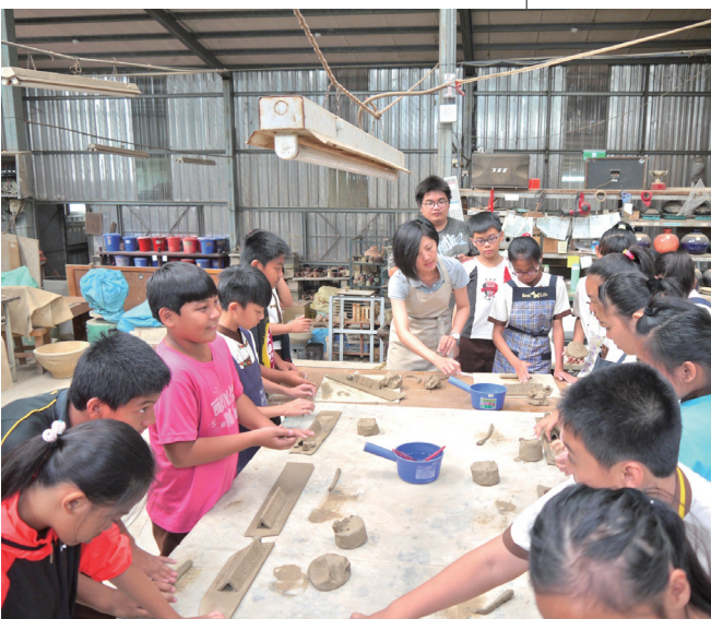
地磨兒國小校外教學活動，現場課程人員在教導小朋友如何製作土器。

文・圖—Garuwai・Zingeru 陳惠美 (屏東縣三地門鄉地磨兒國小校長)