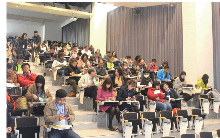
地方政府及學校參與2017年2月16日學校型態原住民族實驗教育說明會。

再確實管考各項推進作為，以克服現況困難，完成原住民族實驗教育之推展。並希望用尊重、積極、真誠、踏實的新服務觀，以原住民族實驗教育課程教學為核心，與原住民族相關機關合作，發展增能賦權導向原住民族實驗教育機制，解決縣市端與學校端的政策需求。培養具原住民族文化內涵與原住民族認同意識，並結合民族智慧與一般教育知能之真正的原住民。◆