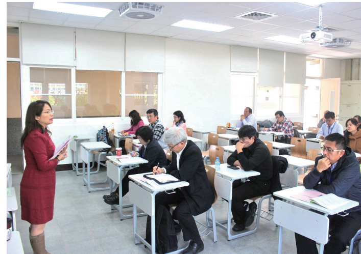
縣市政府、高中職、國中及國小以分組方式，討論原住民族實驗教育之需求或問題。

建置政策應用導向原住民族教育資料庫： 目前教育部按年彙編原住民族學生概況統計，以供各界查詢、應用；原民會亦按年彙編原住民