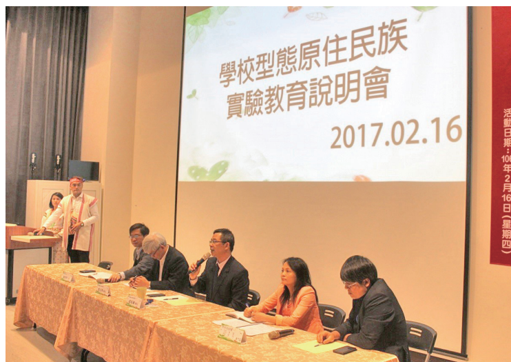
國教署邱乾國署長（中）與台中教育大學及原民會參與綜合座談。

新竹縣關西鎮人，1966年出生。台北教育大學教育政策與管理研究所碩士。現任教育部國民及學前教育署署長。曾任台中市政府教育局副局長、新竹縣政府教育處處長教育部國民及學前教育署國中小組組長、教育部國教司專門委員、教育部國教司科長、台北市政府教育局科員。