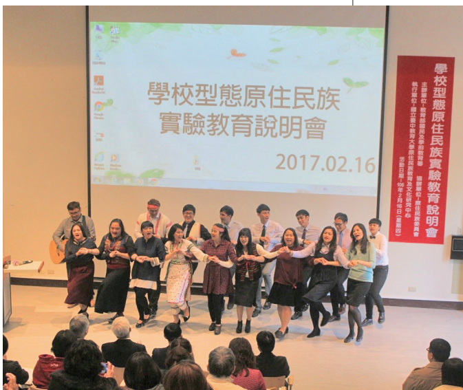
台中教育大學教師專業碩士學位學程專班表演原住民族迎賓舞。