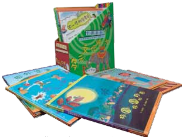
全國首創中、英、日、越、印、泰、緬七國語言的「多元文化繪本」。

交誼區設有桌子、電視、書架與報架（各國語言的報紙），除休憩交流功能外，學員不多時會在這裡上課。中心戶外採用露天咖啡座形式，這樣的設計是要讓新住民媽媽們在這有個擬故鄉場所，沒事也可與同鄉交流、認識。