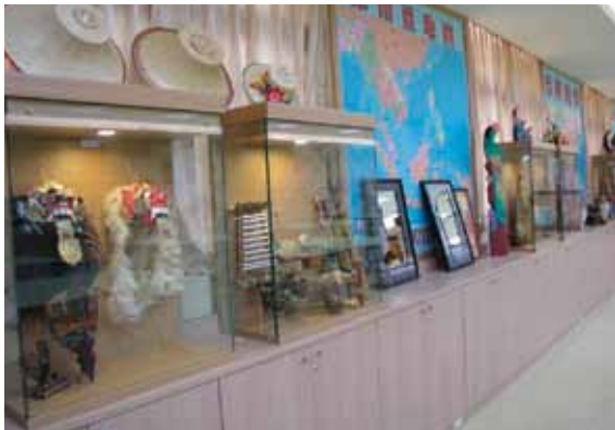
樹林國小國際文教中心展示區。

琳瑯滿目，有美食節、電影節的短片製作比賽、戲劇表演、徵文比賽等等，可以讓新住民文化與當地交流。另外，還有通譯人才的培訓班，完成培訓後更有機會至台北縣政府從事翻譯工作。除了文化交流、工作機會以外，也有機車考照培訓班、電腦班或各式各樣的講座來幫助新住民融入和適應生活。雖然三鶯地區國際文教中心主要是推廣多元文化教育，但其對象並不侷限於「新移民」，像是最近舉辦的活動「紙風車劇團表演」，主要以東南亞民間故事為主軸，但是除了「新移民」以外也有許多一般大眾來觀賞。