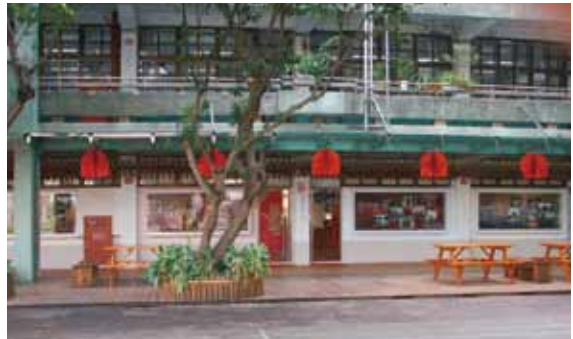
大豐國小國際文教中心外觀。

文山地區的國際文教中心學校為新店市大豐國小，文教中心位在距離大豐國小校門不遠的建築內，交通相當方便，位置的便利性也使其能提供社區民眾更好的服務。大豐國小的新住民學童中，其母親多來自印度、印尼、越南以及泰國等國。