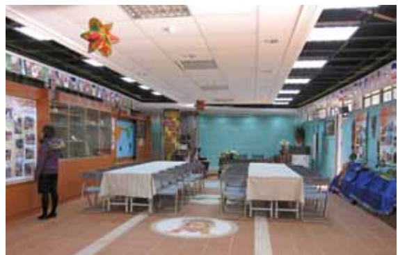
淡水國小國際文教中心舞台區。

另外則是新住民子女的教育問題，由於外籍配偶對於台灣的語言文化並不熟悉，加上父親忙於工作，對於子女的課業不甚重視，造成部分新住民之子課業上較為落後的現象。還有一點需要注意的是，由於社會上普遍歧視、不尊重外籍配偶，外籍配偶在家庭中的地位更是低落，這會使新住民子女的認同產生問題。此外，外籍配偶的主動學習意願低落也是問題之