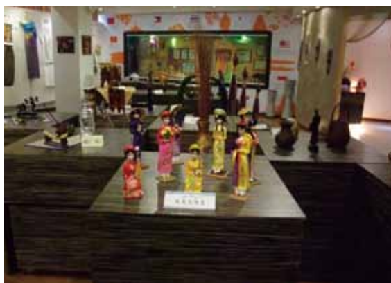
金龍國小國際文教中心展示區：東南亞文物特展（越南篇）。