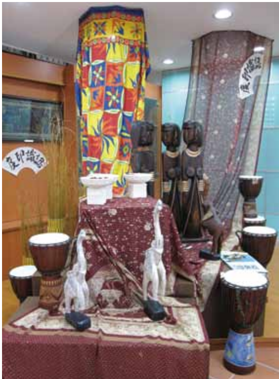
淡水國小國際文教中心展示區：印度文物展。

一，由於需要照顧家庭或是出外工作負擔家計，願意至文教中心學習的並不多，即使報名了也有很多半途而廢的案例。