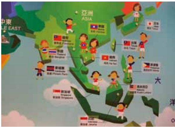
金龍國小國際文教中心互動式學習區。

2009年台北縣政府統計為5,108人，約佔台北縣新住民人口總數的7%。其中汐止市新住民人口總數為3,387人，佔了此區新住民人口總數的66%。