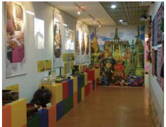
積穗國小國際文教中心展示區。

文教中心提供許多教育方面的相關資訊，其中最具有特色的教育資源有二，第一是繪本，第二是會話。繪本是台北縣政府79年12月最新的一套讀物，每一本都有同時7國的文字敘述（中、英、日、越、印、泰、緬），相當符合多元文化的意義，更符合台灣新移民增加的現象。繪本還有影音互動的功能，可以利用電腦或投影機來閱讀，非常生動有趣。繪本總共有40套，配合星期五早自習的共讀時間，提供老師和學生一個多認識新事物的機會。繪本區不只有台北縣新舊版的多元文化繪本，也有其他適合學童閱讀的書籍，因此也頗有小閱讀室的功能，使文教中心功能更多、更充實。會話的部份則是在文教中心小園地的白板上貼一些簡單的泰文會話卡，讓學生學習。此外，只要班