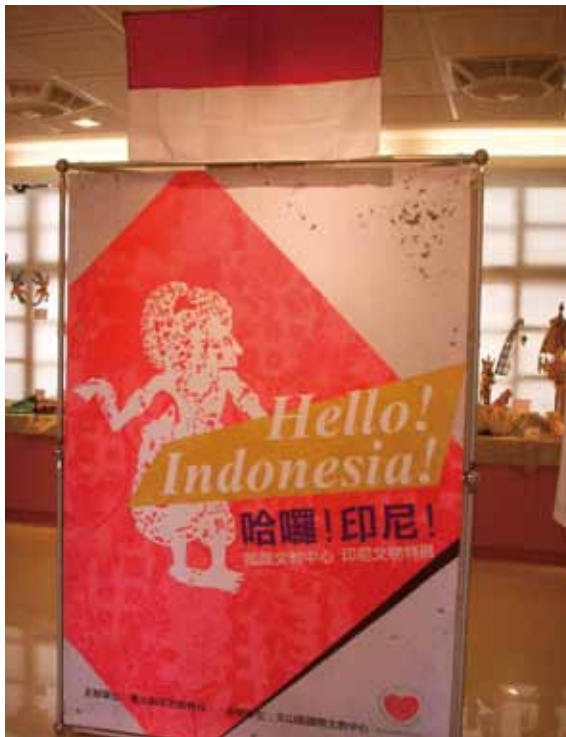
大豐國小國際文教中心印尼展海報。

此外，他們也將各種活動成果製成海報張貼出來，例如協助社區的新移民媽媽認識台灣生活、考駕照等等，這所國際文教中心雖然成立的時間並不長，但是在主任與志工媽媽的努力之下，已有一定的成果。