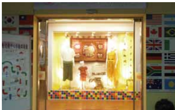
積穗國小國際文教中心門口。