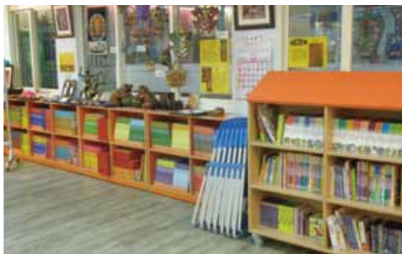
積穗國小國際文教中心圖書區。

文教中心的志工媽媽表示，校方有意再擴大文教中心的空間，提供學生更寬闊的空間、更豐富的資源。這文教中心雖小，但設計巧妙、解說