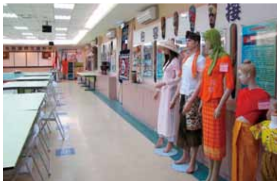
樹林國小國際文教中心內展出多國服飾。