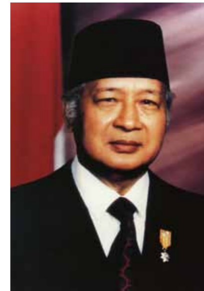
蘇哈托 (Suharto)，印尼獨立以來第二任總統，透過中央集權、軍事主導成為威權政府，其執政期間長達 32 年。

綜合前述，印尼政府於 1998 年後開始重視多元文化教育的推廣，無論在法規內涵或各級學校教育課程及教學，皆可見到多元文化教育的存在，「求同存異」這項精神開始獲得落實。◆