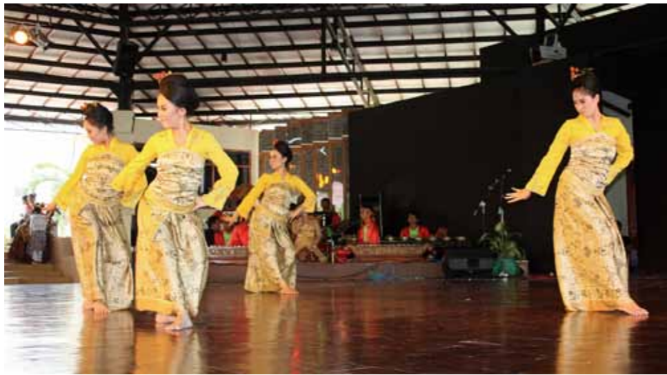
在美麗印尼微型公園 (Taman Mini Indonesia Indah) 表演在地的民俗舞蹈 (Jaipongan)。

元文化發展的重視。如「2006 年教育部第 22 號命令」要求學校與教師須『留意學生特徵的多樣性、當地狀況以及教育類型與層級，不可依宗教、族群、文化、傳統、社經地位與性別做出區隔』；在同年頒訂的「教育部第 23 號命令」則要求所有中小學畢業生皆須具備『尊重宗教、文化、民族群體、種族以及社會暨經濟團體間的差異』的能力。雖有前述的政策宣示，但仍有學者指出「2003 年國家教育體系法」並未明文要求各級學校皆須推行多元文化教育，也未詳訂相對應的懲處規則，讓各級學校有逃避推行多元文化教育的機會。