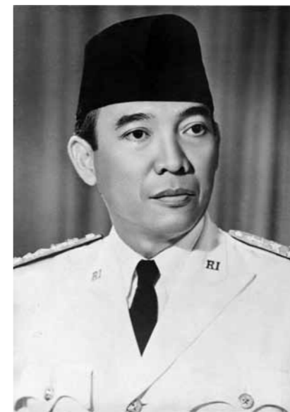
蘇卡諾 (Sukarno)，印度尼西亞民族獨立運動的領袖，印尼獨立後的首任總統，被稱為是印尼建國的國父。

其政策加劇了華人與其他民族群體之間的隔閡。在前述制度之下，華人融入原住民族社會意味著社會地位下滑，連帶地喪失多項特權。再者，原住民族各族在其制度下同屬社會地位低下的一類，擁有共同的被殖民經驗。這份經驗將他們距離拉近，並驅動其領袖發起獨立運動，其目標除了擺脫殖民統治，也包括創建一個由不同民族群體合組的一個新「民族」。