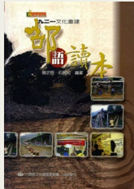
左起：編纂邵語詞典、與簡史朗等人組成團隊編纂各式的語言教材、九二一地震之後，部落及文化重建時編纂的族語教材（錄影帶）。

mathuaw shkuda ihu fuifulh naam a Thau a lalawa numa kahiwan a kazakazash, 您辛苦的教導我們族語和傳統的習俗， tatata wa qali miaqay ihu isa mihu a marutaw a pangka matatash, 每一天您都在桌前努力地書寫， miazai sa isa hudun a patungqaulh, 就像山上的水筧一樣， kahiwan tanatuqash a kafazaqin murushrush makashqut izai a patungqaulh, 祖先的智慧經由你的水筧源源不斷地流下來， kanuniza mathuaw mayaw yamin, 但是我們卻很慚愧， maqa antu yamin mulhkiz pashatalha sa mihu a fuifulhan. 因為我們沒能全然承接您的教導。