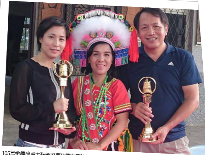
105年金鐘獎馬太鞍部落慶功宴與立法委員高潞·以用(左)及吳明修(右)合照。