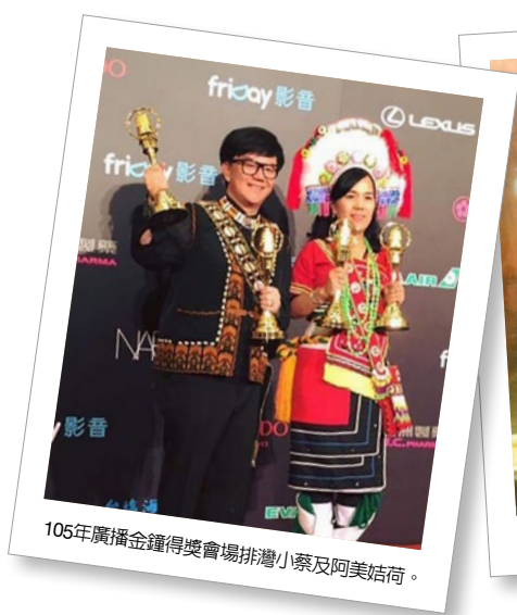
105年廣播金鐘得獎會場排灣小蔡及阿美姑荷。