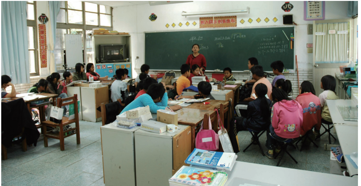
高雄縣桃源鄉興中國小的布農語教學。