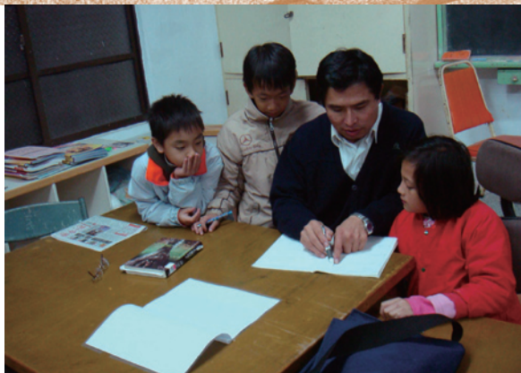
永齡希望小學學生課後輔導班上課情形。