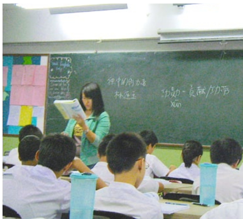
尊孔獨立中學華文科教學現場。