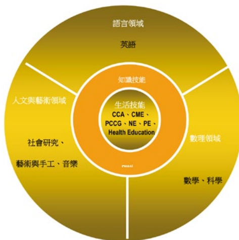
新加坡當前小學課程規劃。