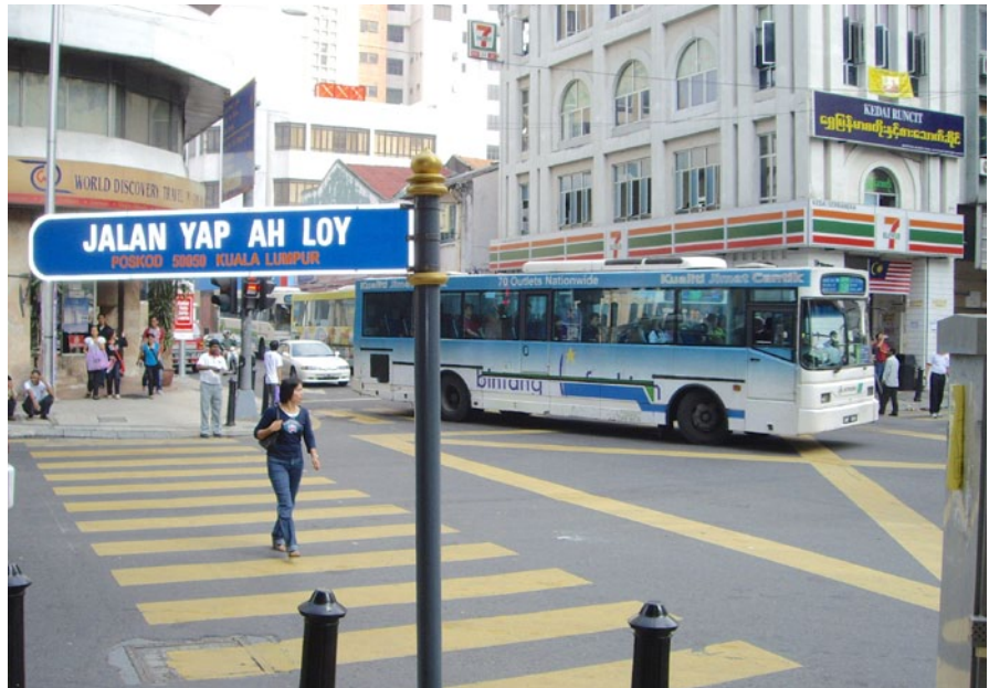
當前馬來西亞街道名仍有些是以著名的華人姓名來取名，圖為以著名的客家人葉亞來（Yap Ah Loy）取名的「葉亞來路」。

馬來西亞的語言主要有：馬來語、英語、華語、淡米爾語。馬來語是馬來西亞的國語和官方用語。英語作為第二語言或通用語言被廣泛地使用在行政、工商業、科技教育、服務及媒體等方面。除未受過正規教育的老年人外，馬來西亞大部分人都能說馬來語和英語。華語和淡米爾語在華人和印度族群社會中廣泛使用。