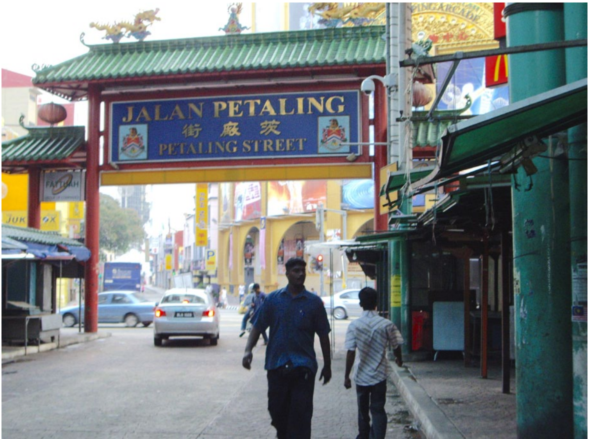
馬來西亞吉隆坡茨廠街（Jalan Petaling）入口。