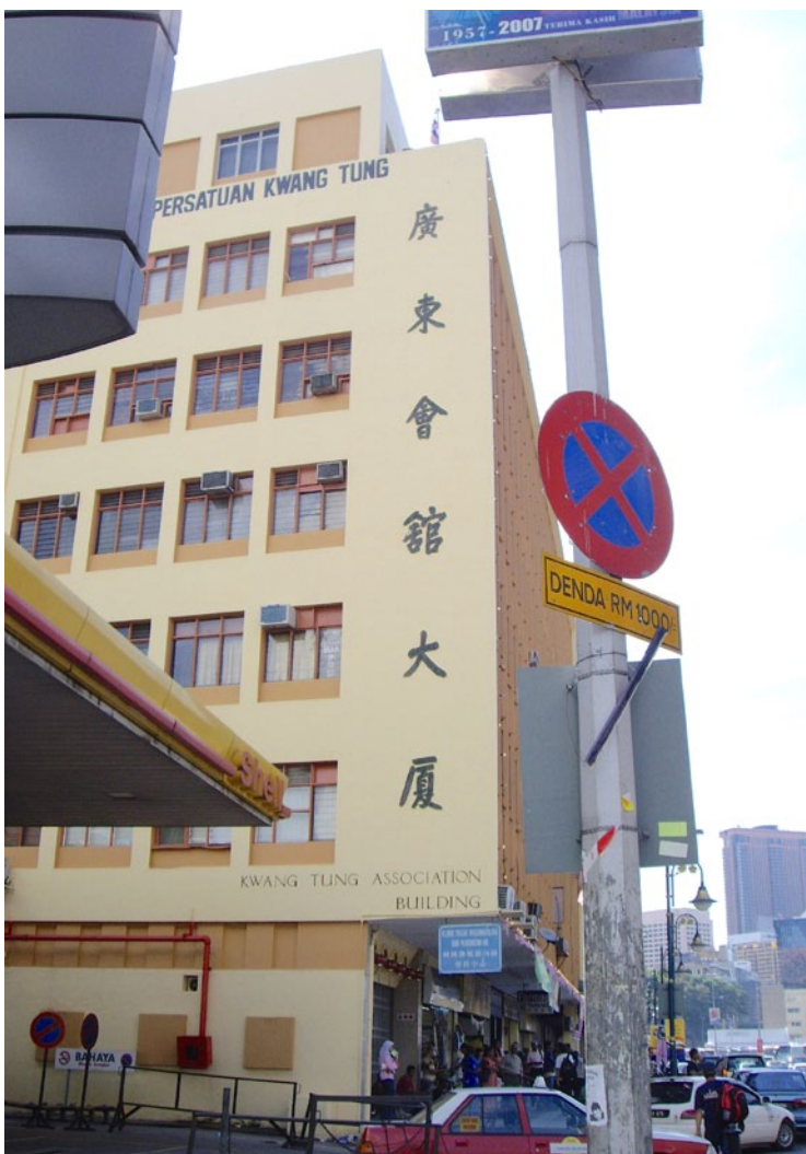
馬來西亞的廣東會館大廈。

相較於新加坡，馬來西亞境內是以馬來人為土著居民（尚有國家土著vs土著的差別），政治基本上由馬來人控制，他們在教育、就業和購買房產上享有一定的特權，（例如，在教育、就業等方面實行所謂「固打」，即配額制），而華人則掌握了國家經濟的大部分。做為非土著的華人和印度人也擁有保留自己的文化、習俗和宗教等方面的自由。就華人來說，有華語學校，出版有華文報紙、圖書，電台、電視台有華語節目。