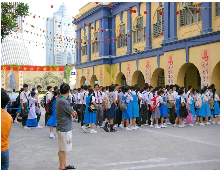
尊孔國民型華文中學 (Sekolah Menengah Jenis Kebangsaan Confucian) 的開學 日。

2010年，馬來西亞的母語政策受到全球國際評比競賽的影響，馬來西亞中學生在TIMSS、PIRLS的成績每況愈下，教育部才驚覺，在「教育人力」與「學習成效」之間，「母語」的定位必須重新調整。例如，教育部2010年的一項公告中針對KSSR在2011年第一階段所應落實的評估之處提出幾項說明：其一，KBSR已經面臨轉變的局面，其新的樣貌即是KSSR，在2011年，將在全馬小學一年級全面實施新課程。其二，基於前述理由，所有的小學皆必須使用教育部編印的KSSR課本。其三，KSSR的每周上課時間為1,380分鐘，每節課最少30分鐘。其四，學校必須根據教師與學生的供需以及學校的改善情形，從選讀模組課程當中至少選擇一門語言課程。KSSR實施至今已進行到小學三年級，無論是國民小學或國民型小學，每周總上課時數皆是相同的，如下表所示；唯