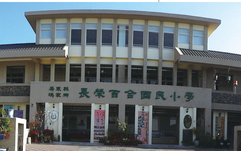
長榮百合國小校舍的正面。