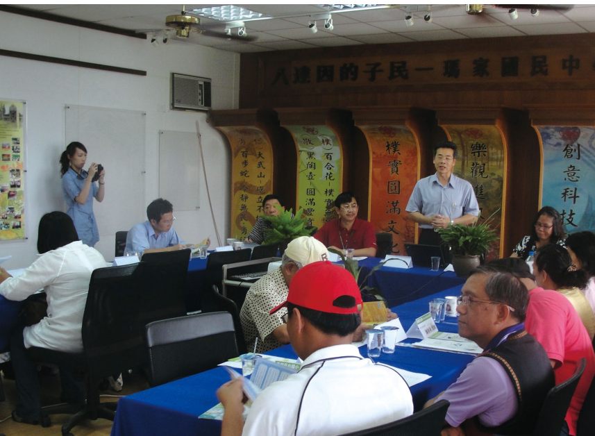
部落菁英參與課程研發。

部落學歷認證用以檢視學生對部落課程的吸收程度，也是學校檢視課程研發成果的機制。依據課程內容，各年級有不同的認證內容，在校生於每年暑假進行認證，畢業班最後一次認證於畢業典禮之前，通過認證的同學於畢業典禮加頒部落學歷證書。依據學習內容與多元評量的精神，採紙筆、實作和問答等方式進行。認證是為了讓學習者學得更紮實，因此此機制有完整專業的執行過程。