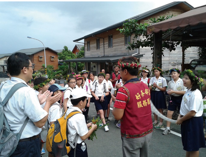
外縣市同學體驗部落遊學課程。