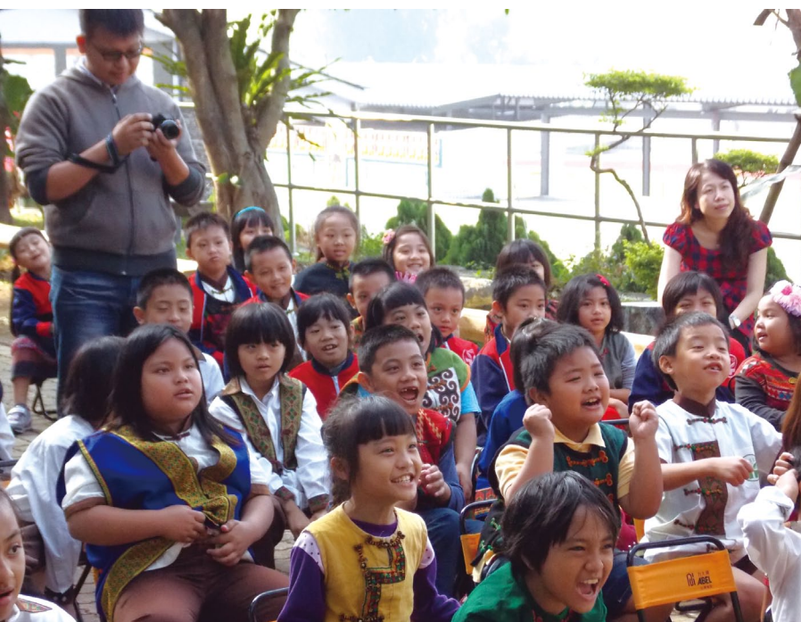
每週五為族語日，委請部落耆老分享Timur在地部落神話故事、日常生活用品及部落禮俗等活潑生動的互動式課程。

中人口及規模較小的村落，也是最晚遷村的部落，故該村仍傳襲著相當豐富的歌謠與文化傳統，也因此舊部落的石板屋及環境都保存良好，是鄉內生態、文化觀光發展的重點部落。德文村（Tjukuvulj）則由4個部落組成，為排灣族的vuculj系統、ravalj系統與霧台魯凱族的匯集地，因地處偏遠、人為開發較少，故自然景觀與傳統文化皆保存完整。近年來德文村致力於咖啡產業的品牌建立，並結合部落營造下的獵人學校與德萊公園，建立在地化的特色與認同感。歷史相當悠久的大社村（Tjavarán），是三地門鄉中最深山的部落，也為Ravalj系統的發源地，村中不乏保存良好的家屋與傳統空間，更有「陶壺故鄉」的稱號，渾然天成的地理環境與人文氣息，孕育出相當多在地藝術家與民族事務參與者。