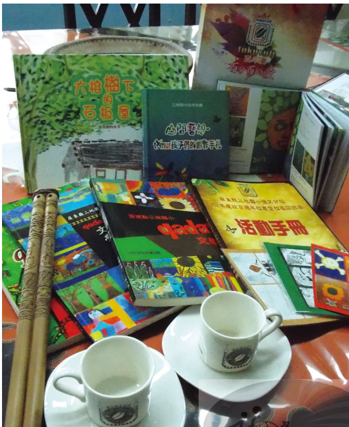
三地國小的校內刊物、學生畫作作品集、繪本及學生親手設計製作的文創品，以不同形式與媒介來呈現，鼓勵孩子不斷創作。

德文分校過去則以咖啡做為校本課程的主軸，災後便更加重視在地認同與環境教育的培養、形塑，故以跨部落的「大德文」概念設計出部落傳唱、咖啡尋奇、生態探索（山林智慧）、生生不息（狩獵文化）等4大主題，並依據「壺孕七力」的學習能力規劃出「根在Tjukuvulj」螺旋系列課程，其中咖啡尋奇的主題課程使學生得以實際接觸、參與部落產業與耕作文化，並與部落共同打造「德文學生咖啡」的品牌與理念。除此之外，該校尚有另一項優勢特色：部落中的獵人學校。獵人學校為部落自主經營的體驗教學營區，與學校經常有密切的合作關係，特別是在寒假針對德文分校及在外求學的德文村孩童，舉辦文化營。文化營不但有部落耆老的支持，更有諸多家長的熱心參與，陪同孩子一起走部落古道、製作傳統狩獵器材、烹煮傳統食物、瞭解民族植物等學習活動，也在此過程中使孩子、家長、族人與部落之間產生連結與凝聚，促使學生的在地認同與學習成效向上提升。