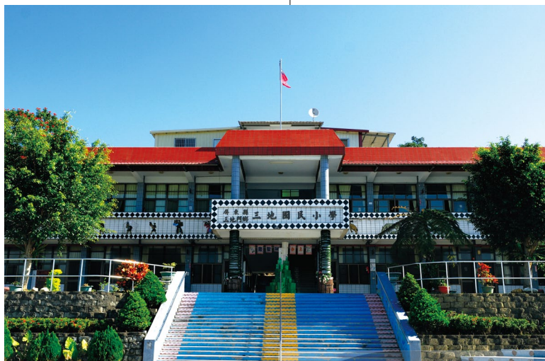
三地國小的Ligu榮耀階梯係已故藝術家吾由設計，階梯述說排灣族祖先起源故事，以馬賽克、木雕與琉璃珠，展現三地村是琉璃珠的故鄉。

山線4村分別為三地、達來、德文、大社4個村落，4個村落中各有其不同的部落特色與產業發展。三地村（Timur）是三地門鄉境內人口與戶數最多的村落，以排灣族人口居多，大多屬於vuculj系統，此外尚有魯凱等多元民族聚居此地，該村不但是鄉內行政機關的所在地，也是人文、藝術與觀光等資源豐沛的部落。同為vuculj系統的達來村（Tjvatjavang）為山線4村