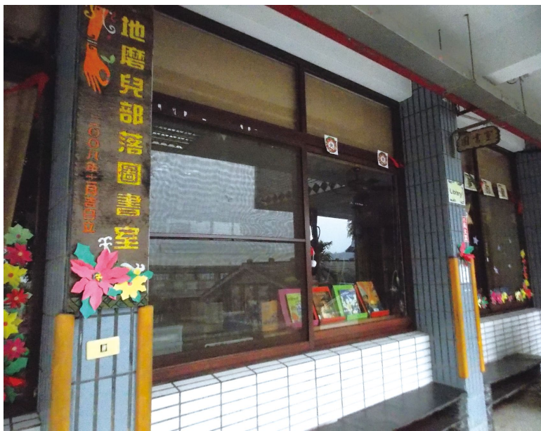
校內的Timur部落圖書室除上課時間開放外，也於週末時段開放予部落社區使用，期待透過圖書室的部落化，使現代知識與傳統智慧於此空間形成匯流。

莫拉克風災之後，三地國小與部落更加積極投入民族教育的推動與實踐，在諸多資源與協助下，已將校本課程的發展，向下延伸至幼兒園，期許學校端能供應每一位部落的下一代更多文化與學習養分，並期待每一位學子皆能認同部落的在地文化，落實「我眼看我部落、我口唱我歷史、我手做我文化」。◆