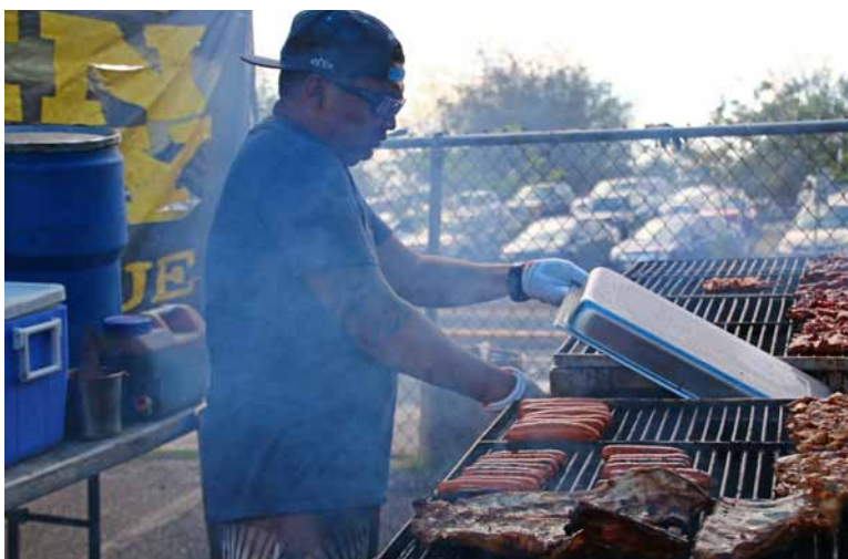
融合了美式與查莫洛口味的燒烤，由此就能看到當代查莫洛文化的混血性格。

統上透過母系氏族的繼嗣結構組成了階序化（hierarchy）的社會，社會階層可被區分為貴族與平民，其中最高階頭目（chamori）名義上是所有土地的世襲所有者，上層貴族（matua）則是這些土地的實際控制者，平民（manachang）則得在禁忌與規範下為貴族工