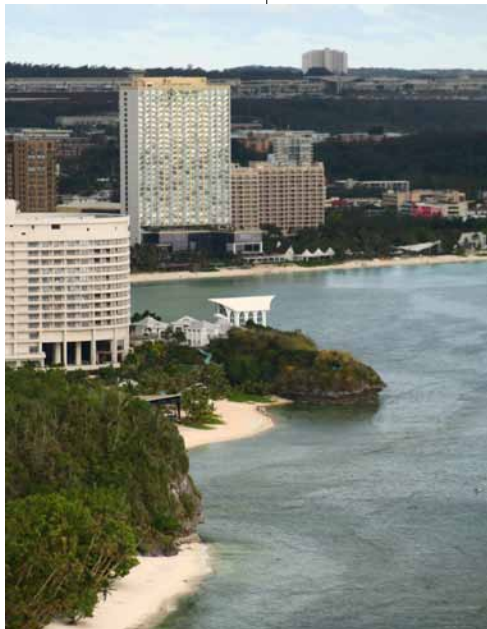
高度資本主義下的飛地。杜夢灣的觀光產業發展是關島人的經濟命脈，絕大多數的關島人與觀光產業及美軍軍需產業有關。

Guåhan是查莫洛人對這座島嶼的稱呼，他們是居住於關島、塞班島、天寧島等被西方人列為馬里亞納群島的原住民族。這裡是密克羅尼西亞面積最大（544平方公里，約兩個台北市大）的火山島，中軸線成東北—西南走向，地勢上則是南高北低，最高峰是南