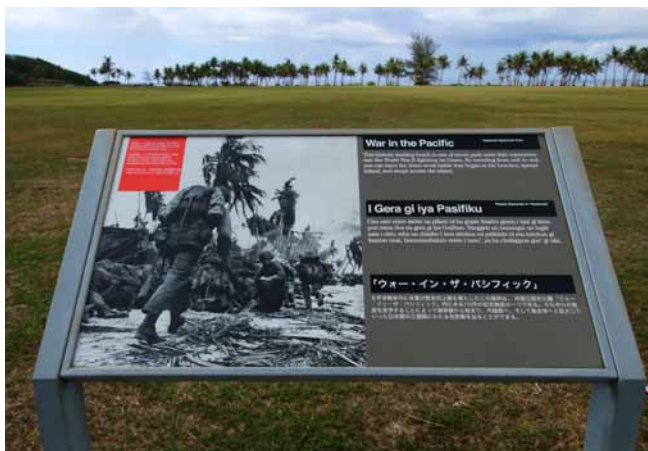
關島位於西太平洋的戰略要點，始終是兵家必爭之地。

表面上是一個無關輕重的註腳，但卻是美國核心力量的具體展現，這裡也是唯一一個美軍能為所欲為卻不需擔心會被轟出去的地方 (David Vine, 2015)。上述文字說明了關島的當代處境：這裡擁有了西太平洋最富裕的物質生活，但卻是奠基於美軍與衍生的觀光事業。美軍基地目前仍佔有關島將近四分之一的土地，隨駐日韓基地的關閉壓力，2010年又開始擴建美軍基地的計畫，企圖使之成為西太平洋的打擊中心，如此擴編，似乎沒有將關島當地人的安全與主權問題納入