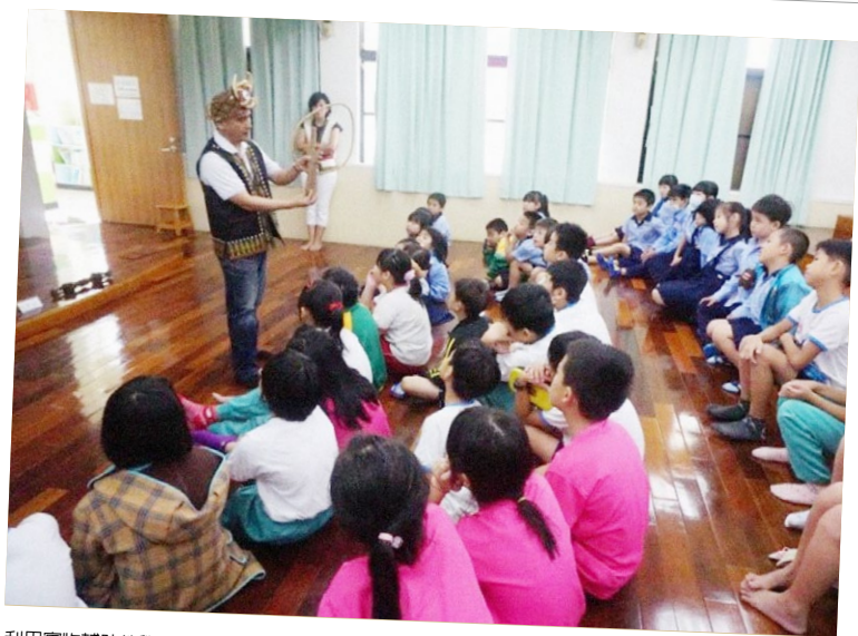
利用實物輔助教學，也較能提升學童專注力。

資源中心文物能活化、多元被運用、被看重。近幾年，本土語言輔導團與支援工作人員，不斷透過工作坊機制，產出相關原住民族教材等資源來建置網路平台，使網頁內容豐富多元，除提供給第一線教師及有興趣者有明確、清楚之資源外，希冀在原住民族教育上得以發揮最大功效。