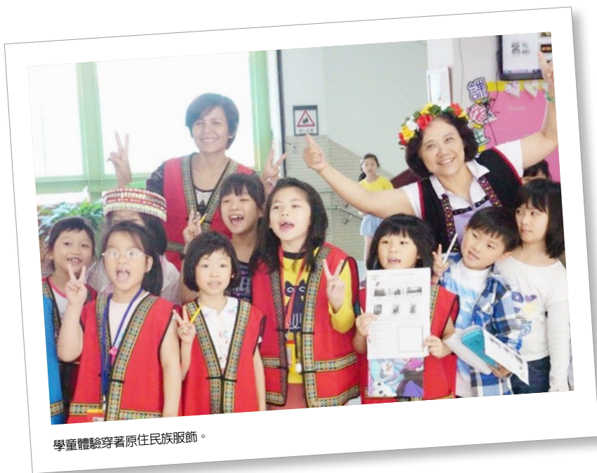
學童體驗穿著原住民族服飾。

東新國小早期是台北市原住民族學生數最多的小學，在推展原民教育各項活動上較有力度及發展空間。如今，為讓