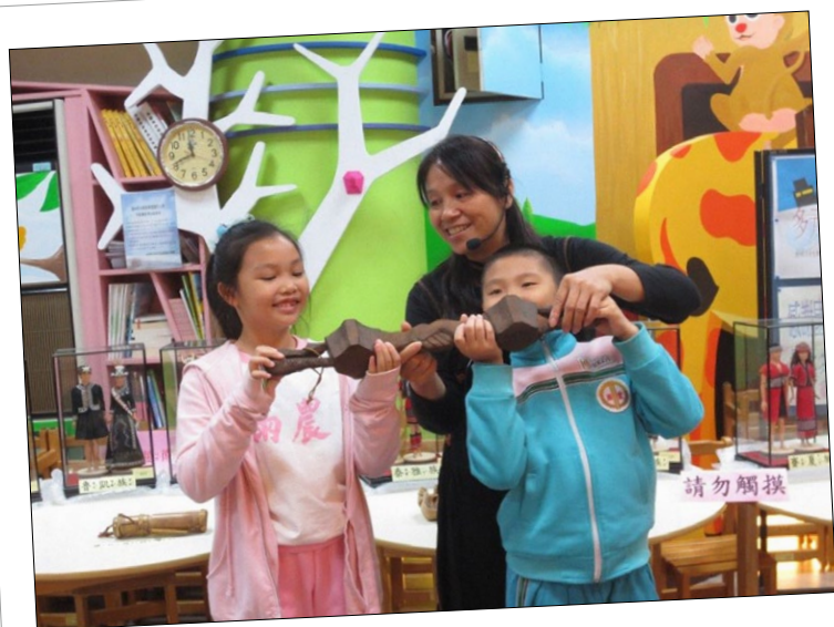
學童體驗排灣族的連杯。

的木製「連杯」，連杯握把上的百步蛇圖騰，乃至雕刻技能、歷史淵源；或是賽夏族臂鈴、高旗在矮靈祭中代表的意涵，獵刀在原住民族獵人文化上之重要性，無一不是原住民族先祖們的智慧結晶及生活精髓。