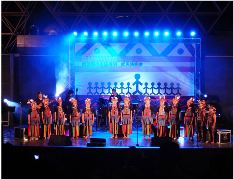
筆者欣賞屏東縣泰武國小古謠傳唱音樂會。

台灣教育政策的運動。對於實驗教育發展成極受關注的教育風潮，真是始料未及啊！而實教盟的發展，也有著異曲同工之妙，這幾年的努力耕耘，超乎初衷地嘉惠了原鄉部落學子；有趣的是爭取立法保障的另類教育組織尚未蒙其利，部落的原民學校及偏鄉公立小校卻先受其惠了！