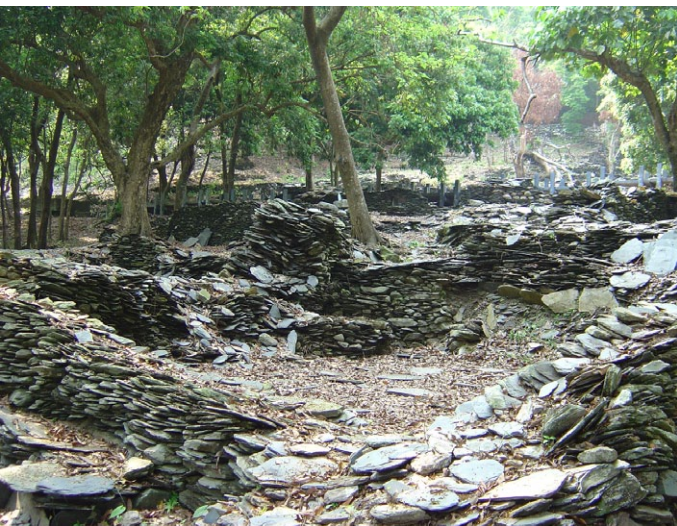
筆者參訪高雄市茂林區魯凱族萬山部落舊居遺址。

了許多被輕忽的潛在危機。雖然這是原民教育極佳的發展契機之一，惟應注意的事項，仍然具有一定的複雜度。