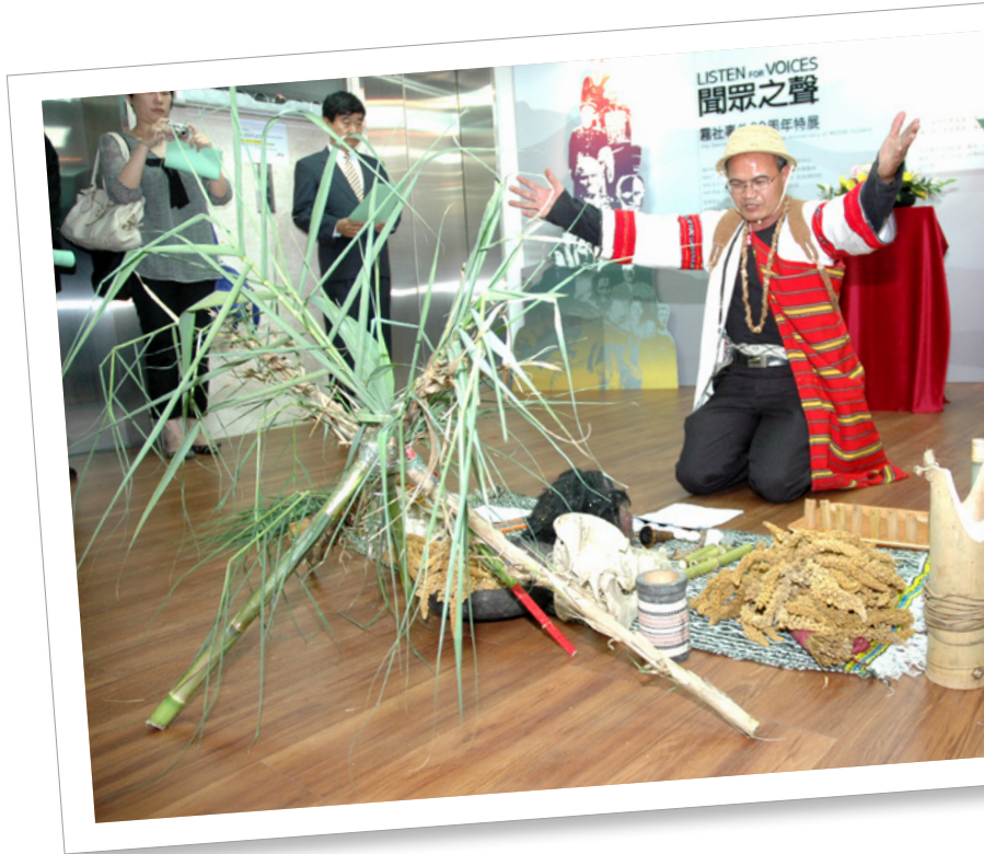
「聞眾之聲——霧社事件80周年特展」。圖為展覽開幕當日賽德克族人告祭祖靈的儀式。

用途，再進行解說，學生可以透過既有的學術知識分析文物，培養對文物的敏感度。除此之外，在博物館裡總是可以看到大量的歸檔資料，除了顯示博物館數位化的趨勢，透過整理與歸檔，可以更有效地管理館藏，提供外界研究民族文化的機會，取得豐富的學識資訊。