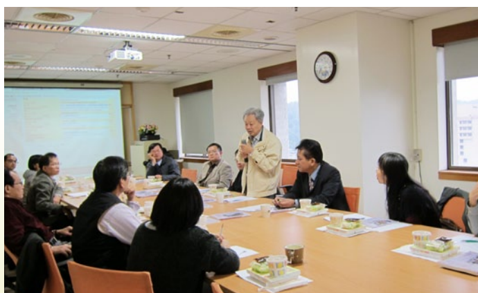
編輯部透過主編會議及編輯委員會會議集思廣益，一方面檢討過去主題的優缺點，一方面絞盡腦汁，思索可以發揮的原住民族教育議題。

為了規劃這些議題，編輯部必須透過主編會議及編輯委員會會議集思廣益，一方面檢討過去主題的優缺點，一方面絞盡腦汁，思索可以發揮的原住民族教育議題。有些議題固然具有意義與價值，但評估文章邀集將遭遇較大困難，不易撐起整期篇幅，只好忍痛割捨。有些議題具有即時性，卻又由於正在發酵，做出專題未必能獲致系統性的結果，也未必找到適切的邀稿或採訪對象，只能先留存起來等待成熟時機。然而，在有限的範圍及資源之下，能夠支撐60個主題，也來自於編輯團隊的專業能力及執行能力，得以上山下海蒐集各方資訊與實務經驗。