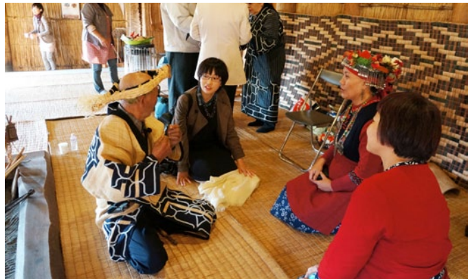
第18期「愛努的民族發展」，編輯部花費了相當大的心思，致力呈現愛努族的現況，政大原住民族研究中心也因此與北海道大學愛努·先住民研究中心建立深厚的學術情誼。圖為2014年10月愛努·先住民研究中心邀請原住民族研究中心、原民會、台灣原住民族文化園區與原住民族地方文物館等學者在白老博物館與愛努族人交流。

其中有兩期更借鏡國外的民族政策案例，匯整編輯專號，分別為日本「愛努的民族發展」（第18期）及紐西蘭「Kia ora!毛利教育傳真」（第39期）。由於這兩期的文章均涉及多語言翻譯與編排（前者為日本語及愛努語，後者為英語及毛利語），編輯部都花費了相當大的心思與精力。