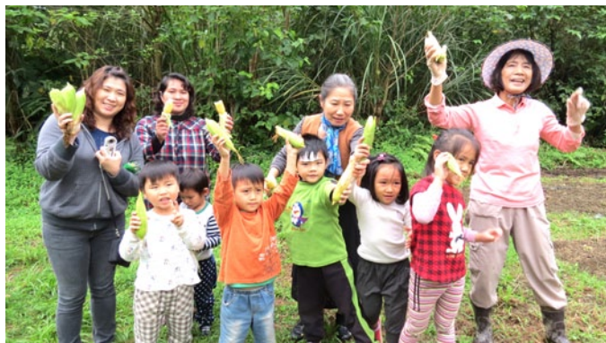
新北市烏來區福山國小的沉浸式幼兒園走入社區進行教學。