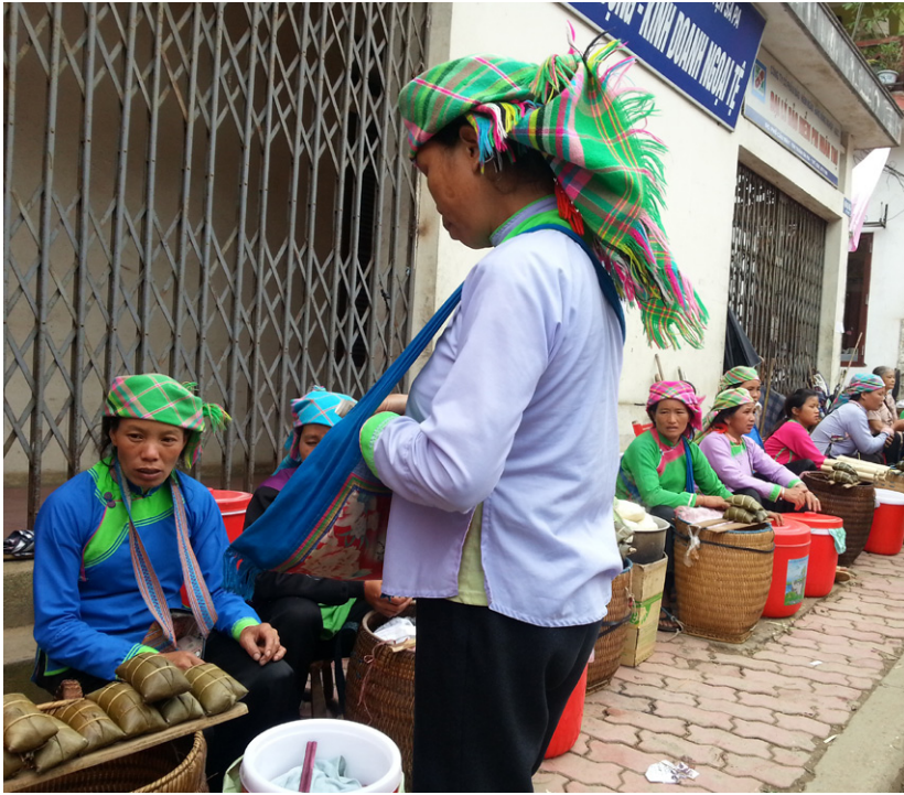
熟依族婦女在市場擺攤，其傳統食物是北部高山地區多民族市場的特色。

或雙語形式出版。族語報紙、族語廣播節目、族語電視節目也日益增加。國家廣播電台、電視台製作許多族語節目，現已有華語、高棉語、占語、苗語、巴拿語、傣語等廣播節目。