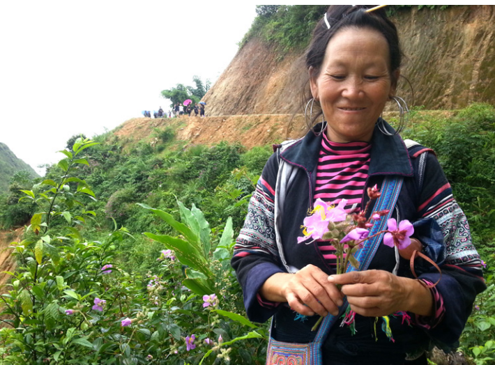
苗族婦女。