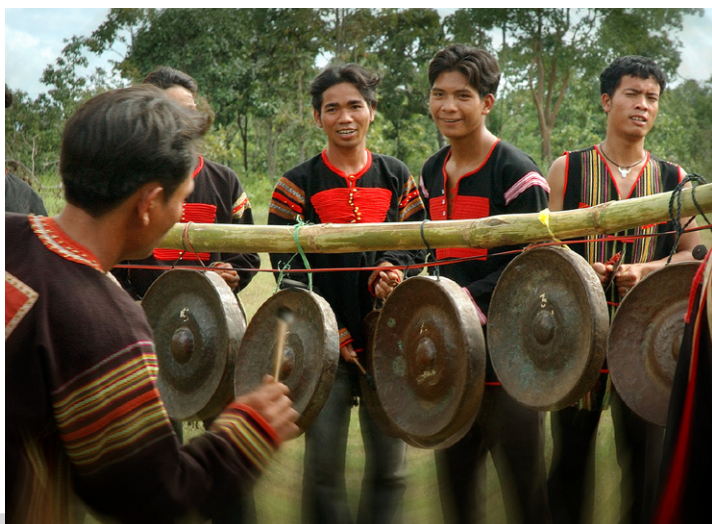
埃地族在敲鑼。鑼是越南南部高原許多民族的傳統樂器，被稱作高原鑼文化空間，聯合國教科文組織（UNESCO）於2005年認定其為人類非物質文化遺產。