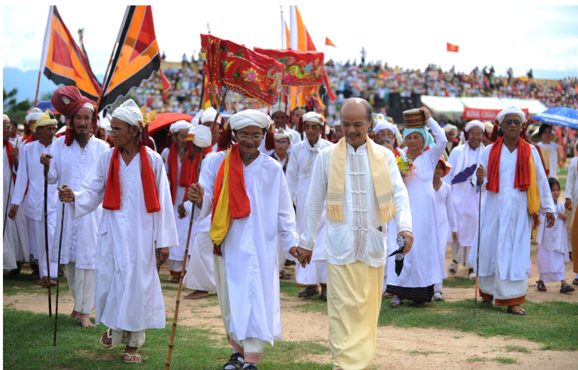
Katé祭，是占族婆羅門支系和拉格萊族每年的最大祭典，占曆7月1日（約西曆9月底10月初）舉行。