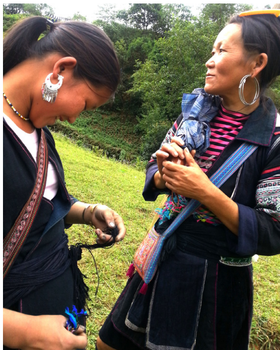
苗族婦女隨時都攜帶手工麻線，其為民族服裝的主要材料，同時是老街省沙壩鎮的重要旅遊資源之一。

少數民族的參政率日益增加，當選國會代表的少數民族人數比例目前高於少數民族人口比例。在最近4屆的國會任期內，當選國會代表的少數民族比例占16%左右。