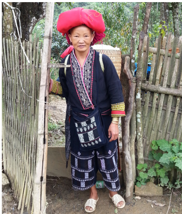
瑶族的紅瑶人支系婦女，紅瑶人的文化是越南北部老街省沙壩鎮的重要旅遊資源之一。