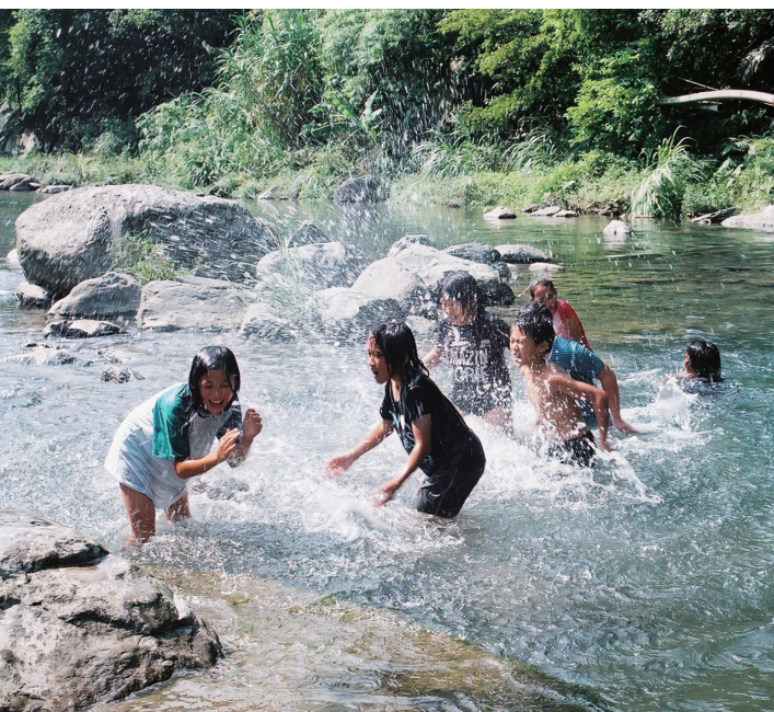
到戶外上自然課，讓孩子多多接觸大自然。

5年正規師範教育訓練與薰陶，臨畢業前夕，捫心自問：「你準備好了嗎？」。認真地思索這嚴肅的課題時，心理卻充滿不安與焦慮。怎麼辦？幸虧，1977年台北縣政府新進教