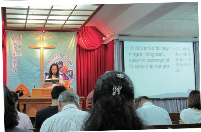
星期日的族語講道。

線逐漸退守。行政院原民會於2012年補助推動教會族語紮根計畫，對於原本就希望能在教會營造族語友善空間的牧者來說，起了一次激勵的作用。參與的教會得以更加積極的落實