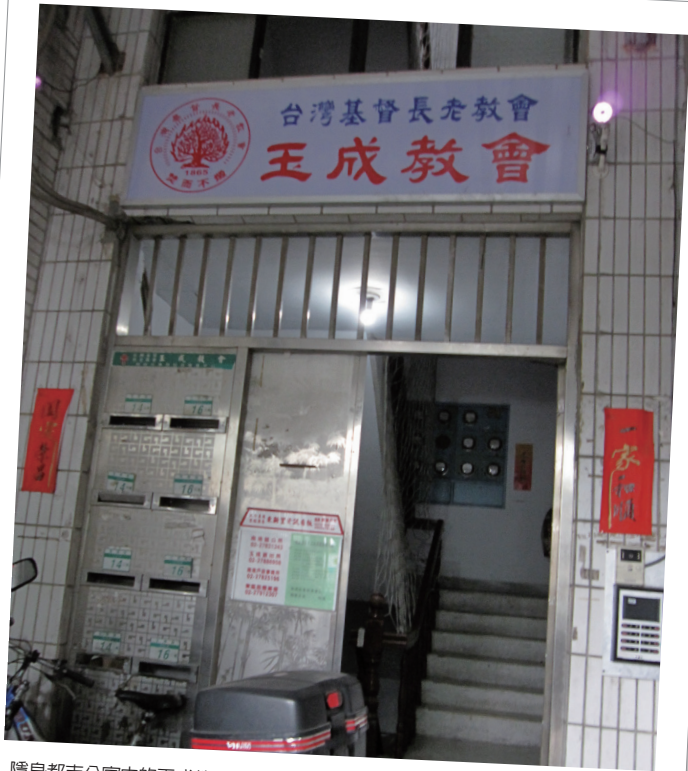
隱身都市公寓中的玉成教會。

由於族語人口老齡化及華語教友已成長至40歲左右的中壯年齡層，為了讓年輕的教友能夠理解傳教的道理，全族語禮拜的防線逐漸退守。行政院原民會於2012年補助推動教會族語紮根計畫，適可檢視各教會推動族語的態度及難處，而族語講道是否讓華語教友因而走出教會的問題便於此浮現。