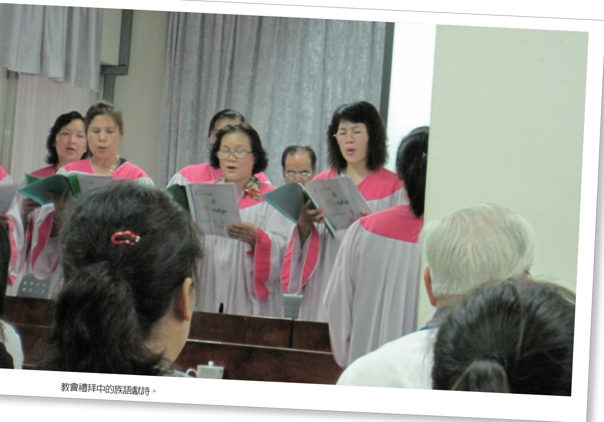
教會禮拜中的族語獻詩。

的給賴·琶義子總幹事反而認為族語並非教友流失的主要因素，因為教會還有其他的聚會與活動可以吸引年輕教友參加。不過，阿美中會希僕文總幹事卻也反應花蓮的狀況：「確實因為族語使用的關係，讓教會流失年輕教友，例如在花蓮市的浸信會，因為是用華語進行禮拜，所以吸引了許多原本是長老會的年輕教友。」。