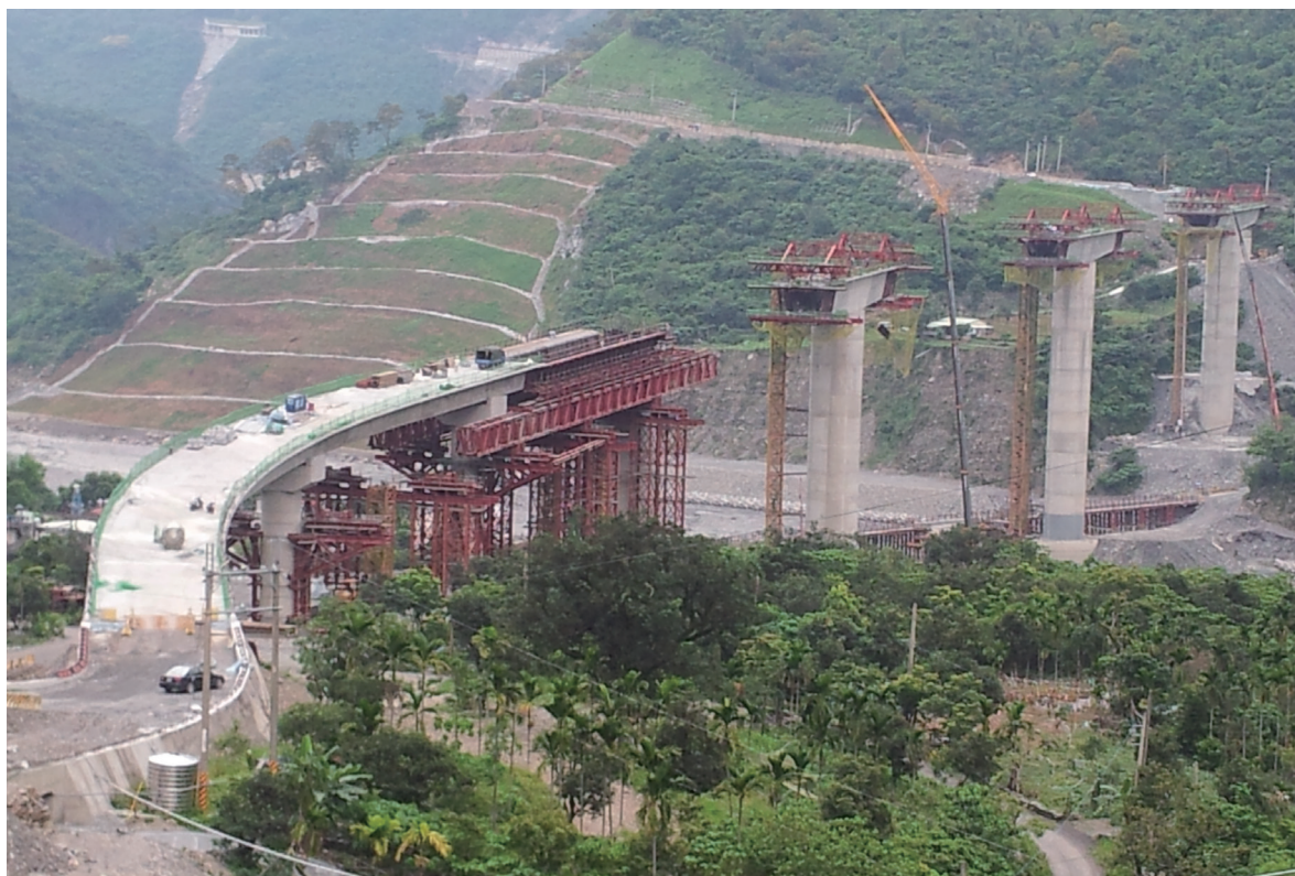
從交界區到原鄉學校的通勤之路，雖有美景，但路況通常不佳。