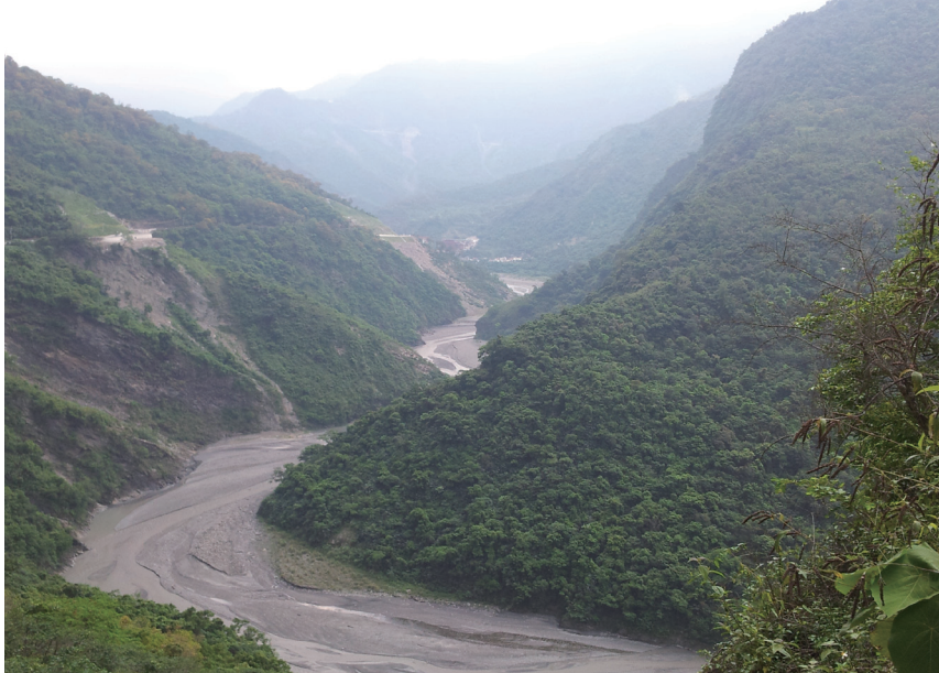
從交界區到原鄉學校任教通常需要跋山涉水。

範體系畢業後留在原鄉或返回原鄉任教，是這群教師對於後輩教師的期望，而對目前居住在交界區而任教於原鄉學校的原住民教師，政府與原鄉學校又打算施以何種配套措施，是這群教師的心聲。