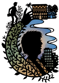
◎交界區示意圖（本期文章涵蓋範圍）

本期引用的「交界區」概念是指地理空間，專門用以指涉原住民鄉周邊的市或鄉或鎮，也就是位於都市和原鄉之間的中間地帶。對許多原住民教師來講，原鄉可能是他們的故鄉，也可能是他們長期任教的他鄉，卻不見得是他們目前居住的地方，這種情況隨著原住民教師的都市遷徙而日益增加。