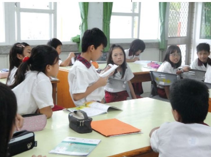
台東縣瑞源國小學童為《捕捉太陽的女人》進行故事創作。

太陽。另外三個太陽，因為在路上玩耍而逃過一劫，被眼前这一幕嚇得說不出話來，非常的驚訝與害怕，覺得這些女孩太