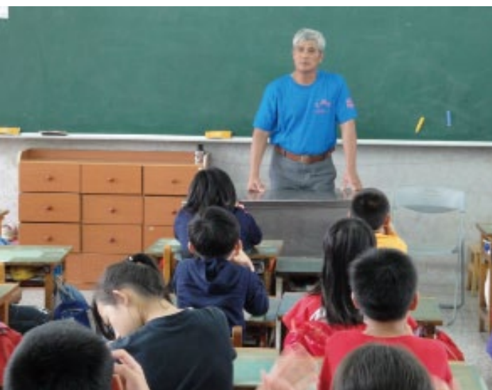
台東縣瑞源國小製作《捕捉太陽的女人》，請阿美族耆老到校說傳故事。

《捕捉太陽的女人》是由瑞源國小99學年度五年級全班24位學童共同創作，以阿美族的傳