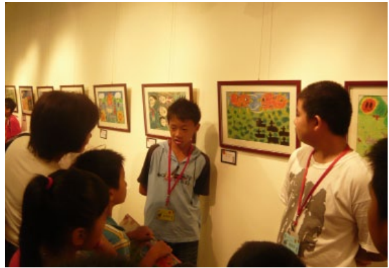
《捕捉太陽的女人》原畫展，小作家親自配合畫作說故事。

我們期待透過繪本創作、出版之歷程，養成孩子關心家鄉人文的情懷、享受閱讀與創作的樂趣，同時透過同儕學習，將自己的長才凸