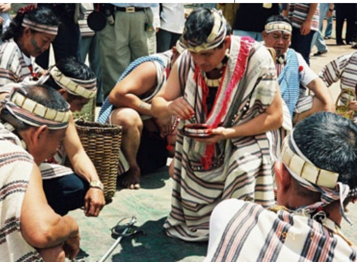
1999年太魯閣建設協會假花蓮縣萬榮鄉萬榮村舉辦的「祖靈祭」，是當代Truku「民族」建構的「第一次」祭典。