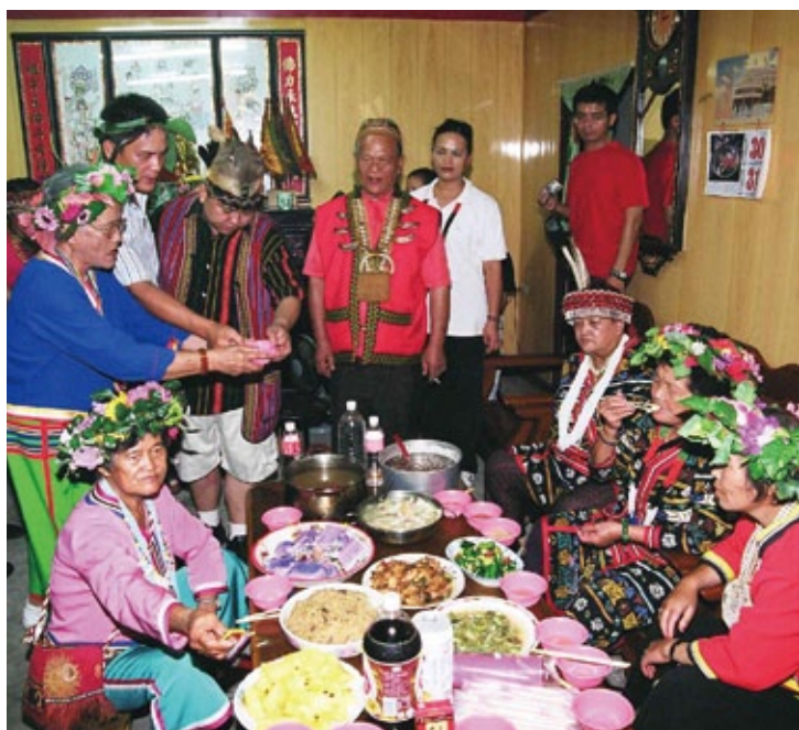
邵族的新年敬酒，在農曆8月1-3日，每戶準備各式佳餚與美酒舉行喝tuqtuq的儀式。

隱含著狩獵是一種集體的活動。最特別的儀式是在7月3日，族人需準備白鰻魚造型的糯米糕為祭品，每一條白鰻麻糬上都貼有各戶家主的姓名紅紙，所以這天也可以稱做Mulalu tuza (拜鰻祭)。族人會將自家公媽籃拿到頭人家中，請先生媽隆重祭禱，請祖靈保佑子孫福壽綿延。