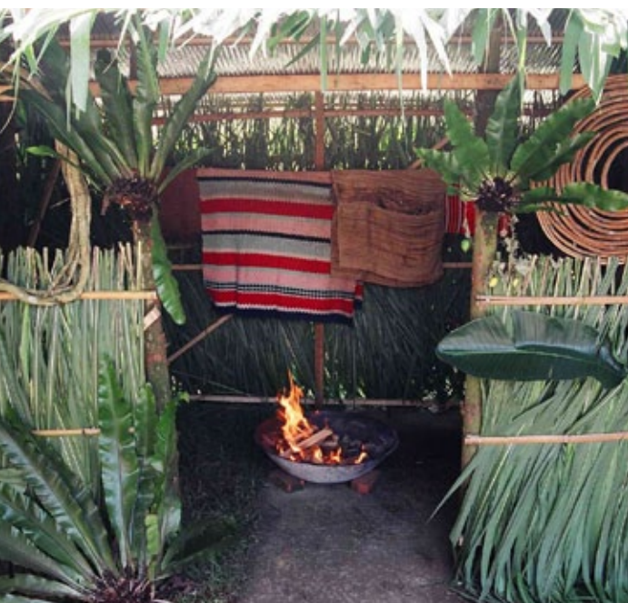
祖靈祭要蓋hanaan (祖靈屋)，先生媽舉行儀式請祖靈來到祖靈屋，屋中放置酒、火塘、毛毯等供祖靈使用，與族人同樂。