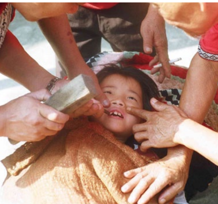
邵族過年第三天，舉行小孩鑿齒儀式，祈求祖靈庇佑少年平安長大。