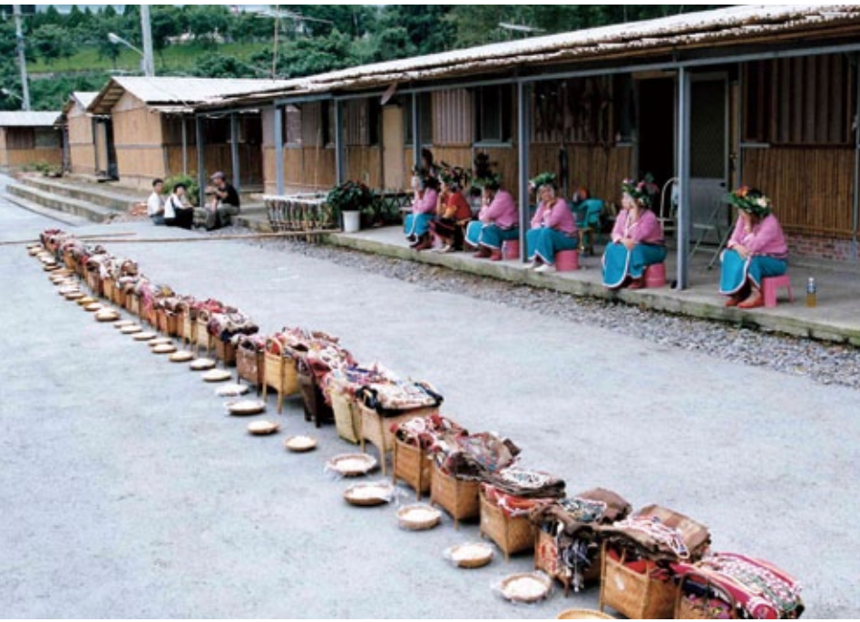
邵族新年的集體祭典，各家的公媽籃集中於公共祭場向祖靈祝禱。

放哪一天好呢？不太好弄，經過討論，我們還是斟酌一下，最後就選祖靈祭的第一天，因為那天晚上我們有杵音表演，最好第一天放假日之後是禮拜六，不然就是1天而已，沒有連假，族人要回來也不容易。我們的祖靈祭是以平地人的農曆為主，每年都是農曆的8月1日開始，所以就訂那天為邵族的放假日。這樣年輕人不管是工作、就學都可以放假回來。水里鄉那邊已經沒有這個祭典，但是他們會有人來參加，例如那邊的耆老、祭司。」雖然歲時祭儀放假日很有彈性，例如阿美族、鄒族是採取一段期間而非明確日期，但石委員說邵族的討論真的不太複雜，基本上大家都算同意。