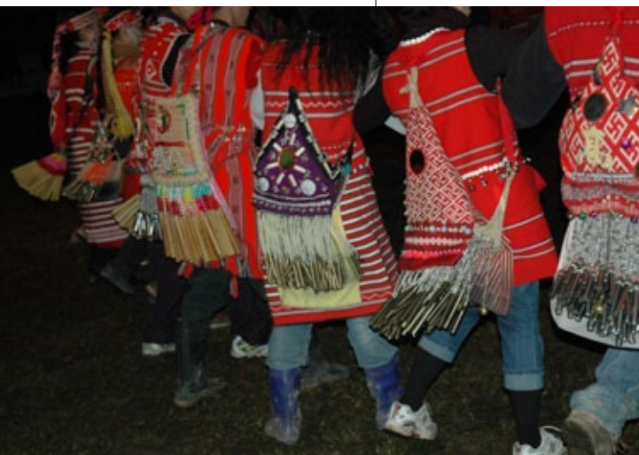
矮靈祭的臂鈴。

paSta'ay的祭司由朱姓擔任，南祭團的司祭固定由朱家大宗擔任，北祭團的祭司則由朱姓各家輪流擔任。祭典前的籌備階段，包括各種準備工作，有約定祭期、結繩約期、討論會、協調會、結芒草結、預備等。祭典儀節的過程，則有迎靈、延靈、娛靈、逐靈、送靈。祭後儀節包括賞勞、答謝（慶功宴）、送矮妣於