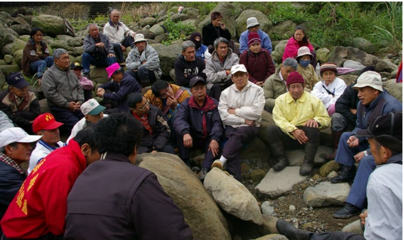
每逢民國紀年雙數年舉行祈天祭大祭，與paSta'ay (矮靈祭) 一樣，第一天上午在中港溪畔舉行ayalaho (溪邊會議)，商討祭典事宜。