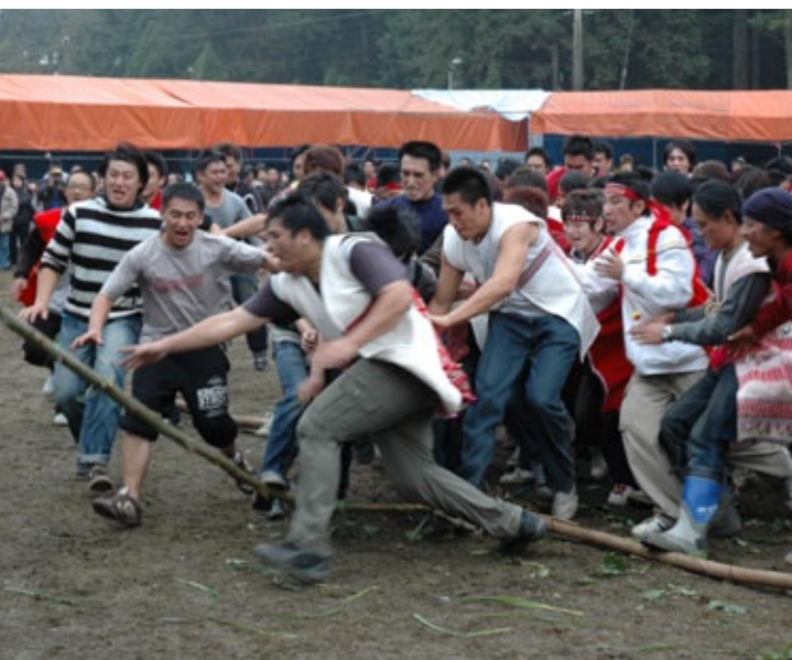
矮靈祭最後一天的踩籐木。