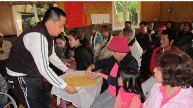
在祈天祭儀式中，小米經過烤乾、脫穗、舂打、蒸熟、揉糰後，以米籩裝著分給參與的族人食用，此時門窗需緊閉，不可交談及喝水。

確定是paSta'ay。我們最大的問題是paSta'ay是兩年一次，如果我們選擇paSta'ay為國定假日，就會損失一天放假日。當時有兩個建議，第一是在paSta'ay這天集中放假兩天，第二是paSta'ay只放一天，第二年再挑其他的祭儀來放假。因為這個有關法令的問題，集中放假要在哪兩天？大家都有不同的意見。雖然法令上是可以配合我們的習慣來突破，但是大家還是偏向每年就輪流放假，所以再討論一個可以放假的祭儀，最後是尊重南庄的習俗，確定以'oemowaz ka kawaS做為paSta'ay隔年的放假日。」