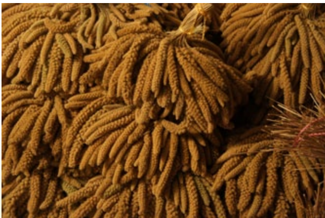
小米是過去的主食，亦是傳統文化與儀式不可或缺的象征。

依據內政部「紀念日及節日實施辦法」第4條規定，遇原住民族歲時祭儀應放假1日，各原住民族放假日期，由行政院原住民族委員會參酌各原住民族習俗、召集各族人士研商，完成各族歲時祭儀日期調查，決定放假日期後，刊登政府公報。原民會在2010年11月該法條修正發布後，就開始展開行動，讓14族的族群委員回到部落，在各縣、市政府協助下，召開「研商原住民族歲時祭儀調查會議」，由各族耆老、部落代表與會討論，取得族人們的共識，確定一個本族認