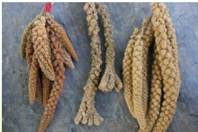
不同品種、用途之糯性小米。