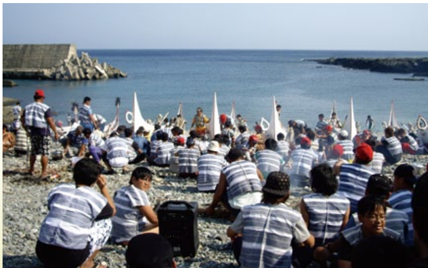
雅美族對歲時祭儀的時間觀念是依循傳統曆法，圖為朗島部落招魚祭。

住民無法參加，現在，在自己的節日返鄉參加祭儀，這是原住民族應該要有的認知，只有如此，原住民族的歲時祭儀文化，才能找到持續的生命力，屬於原住民族的節日，才顯得出價值與意義。◆